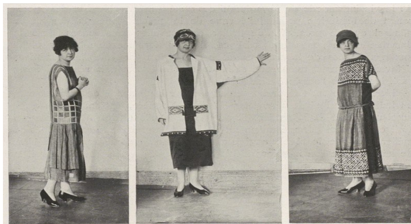
Figura 4. Modelos con diseños de Nadezhda Lamanova presentados durante la Exposición de Artes decorativas e industriales modernas de 1925 (L'Art Decoratif et Industriel de l'U.R.S.S., 1925:43)

Otras diseñadoras de moda e indumentaria para teatro como Aleksandra Aleksándrovna Ekster (1882-1949), Nadezhda Lamanova (1861-1941) o la diseñadora Liudmila Mayakovska (1884-1972), que desarrolló exitosamente tejidos y textiles durante la misma época (Ginsburg, 1993), han pasado silenciosamente a la historia a pesar de haber tenido un gran éxito en su entorno durante las primeras décadas del siglo.