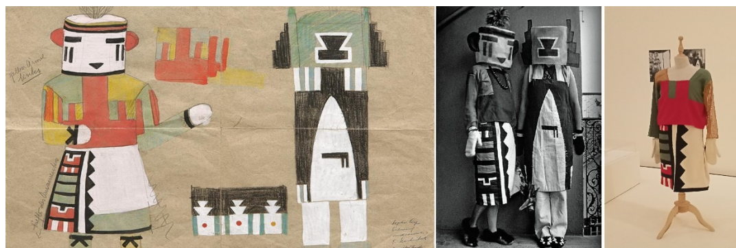
Figura 6. Diseños de Sophie Tauber-Arp para vestuario dadaísta, c. 1922. A. Gouache y crayón sobre papel. 50 x 34,9 cm. © Arp Museum Bahnhof Rolandseck. Photo Mick Vincenz. B. Sophie y Erika Tauber llevando los trajes © Archivos de la Fondation Arp, Clamart. C. Reproducción de uno de los diseños.

Por su parte, la suiza Sophie Tauber Arp (1889-1943), se perfila a día de hoy como una figura central del movimiento de vanguardia dadaísta, aunque su aportación y amplia obra quedó, una vez más, empalidecida por ser la mujer del artista Jean (Hans) Arp.