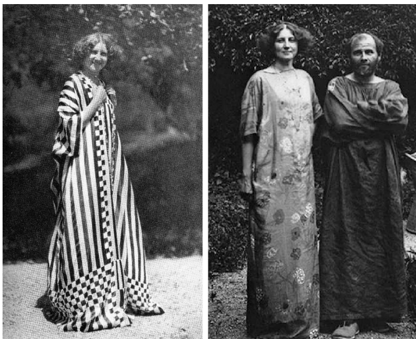
Figura 2. Louise Emilie Flöge y Gustave Klimt, entre 1900 and 1909 con sus túnicas y vestidos saco. (Husslein-Arco y Weidinger, 2012).

Dentro de las corrientes modernistas, es también mencionable Margareta von Brauchitsch (1865-1959) descrita ya en su época como una artesana y bordadora de gran talento (Chadwick, 1992). Figura destacada del Jugendstil , movimiento modernista alemán, su contribución al diseño del siglo XX, aunque muy poco conocido en la actualidad, fue notable. Formada principalmente en pintura, desde finales de la década de 1890 trabajó con diversas técnicas y materiales, como el vidrio artístico, azulejos o papeles pintados, aunque los textiles fueron el centro de sus actividades (Un/Seen Designers).