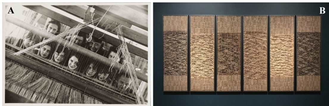
Figura 5. A. Estudiantes del taller de tejidos de la Bauhaus. 1927-1928. B. Anni Albers. Six Prayers (1965-1966). Paneles de algodón, lino, e hilo de plata. The Jewish Museum Collection, Nueva York