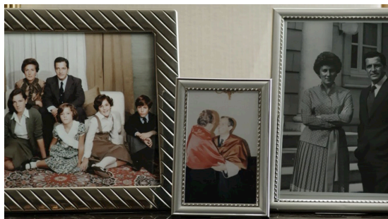
Fotograma de la miniserie Adolfo Suárez, el Presidente

Cuando Suárez y Amparo salen a la terraza, la imagen se va a blanco y se hace un barrido por las diferentes fotografías antes comentadas con el acompañamiento del tema musical asociado al personaje.