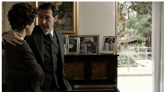
Fotograma de la miniserie Adolfo Suárez, el Presidente

verdadero Adolfo Suárez y de su familia, en el mueble que hay detrás de los personajes.