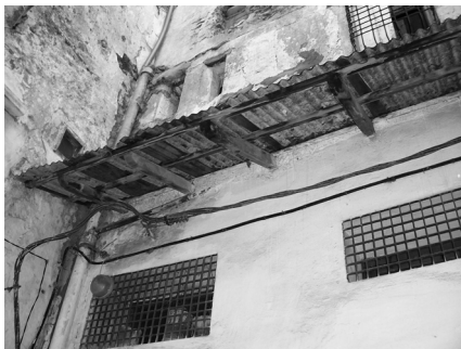
Foto 4: En la mitad superior, ventanas de una almacería de la medina de Tetuán (Marruecos). Diciembre 2005. (Foto de la autora).