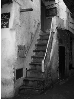
Foto 1: Escalera de acceso a una almacería de la medina de Tetuán (Marruecos). Diciembre 2005.