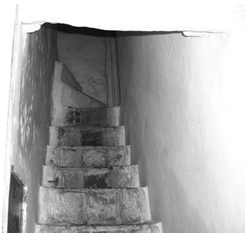
Foto 3: Interior de la escalera de una almacería de la medina de Tetuán (Marruecos). Diciembre 2005.