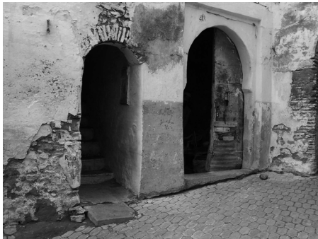
Foto 2: Fachada de una almacería de la medina de Tetuán (Marruecos). Diciembre 2005.