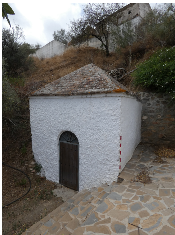
Figura 11. Alcubilla de Vallejo.

un cerro ubicado al este del cerro de Cantoblanco y que servía como mojonera entre Almáchar, Benaque y Moclinejo o dicho de otra forma, entre las tierras axárquicas dependientes de Málaga y la ṭā'a de Comares. Al igual que esta función, tenía otra importante debido a su altitud, la de atalaya que vigilaba tanto gran parte de la Axarquía y ṭā'a comareña como el viario que pasaba por él. Desafortunadamente no se ha conservado ningún vestigio arqueológico, más teniendo en cuenta que la cima se ha aplanado, sin embargo, durante la catalogación de yacimientos arqueológicos de Benaque y Macharaviaya, se constató la presencia de fragmentos cerámicos a torno, tejas curvas y mampuestos que pudieron formar parte de este oratorio 132 . Dicho topónimo se perdió posteriormente para denominarse cerro Vallejo en honor a la pedanía de su falda suoriental. Precisamente en el caserío de Vallejo se conserva una alcubilla cuyas características formales nos recuerda a la de Cútar 133 , si bien la alcubilla de Vallejo no ha sido asociada a una rābiṭa (fig. 11).