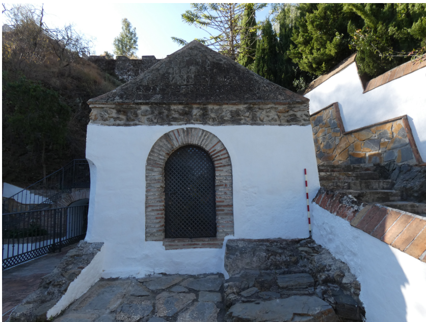
Figura 8. Alcubilla de Cútar.

Finalmente, descartamos que la alcubilla de Ainaalcaharía ( ‘ayn al-qarya , fuente de la alquería) fuese en origen una rābiṭa , pues si bien la edificación existente nos recuerda a este tipo de oratorio al poseer una planta casi cuadrada de 3,40 x 3,34 metros, una bóveda vaída de ladrillo, un tejado a cuatro aguas y con una puerta y una ventana con arcos de medio punto de ladrillo, su localización en una cañada junto a una mina de agua que surtía dicho líquido a la inmediata alquería cutareña, nos obliga a pensar que más que ser un oratorio, fuese una alcubilla para decantar el agua 116 (fig. 8).