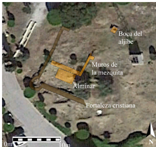
Figura 5. Dibujo de la planta de los restos emergentes de la mezquita de Bizilyaña y de la fortaleza cristiana superpuesta.

bóveda de medio cañón. Teniendo en cuenta esta técnica y tipología constructiva, se ha propuesto una cronología califal relativa a los siglos X-XI 45 (fig. 6).