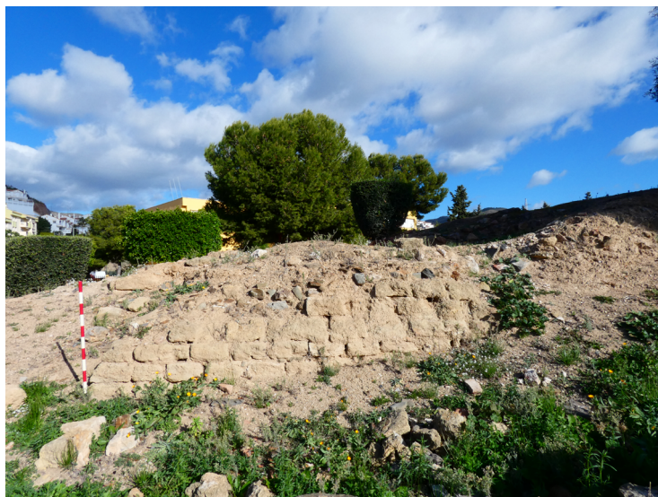
Figura 4. Cara occidental del alminar.

En cuanto a la base del alminar, fue construida a base de sillares 44 , cuyo lado sur mide 3,90 metros, el lado oriental 1,05 metro y el lado occidental 2,40 metros, cuyo alzado es de un metro de altura (fig. 4). En la esquina noroeste, se proyecta un muro en dirección sureste-noroeste de 1,60 metros al menos y conservando una anchura de 1,20 metros, cuya técnica constructiva es a base de mampostería y sillares. En la cara opuesta de este muro, es decir, la cual mira hacia el noreste, la longitud es de 5,40 metros. A 2,20 metros al sureste de este muro, se levanta otro muro a base de sillares que presenta una longitud de 6,30 metros con una dirección suroeste-noreste y teniendo una anchura de 0,70 metros. Al final de este muro, hacia el noreste concretamente, parece distinguirse una esquina al existir un ángulo de 90 grados en la obra, proyectándose un muro hacia el sureste a lo largo de 1,25 metros conservados, si bien hay restos del muro que continúan 0,95 metros hacia el noroeste (fig. 5).