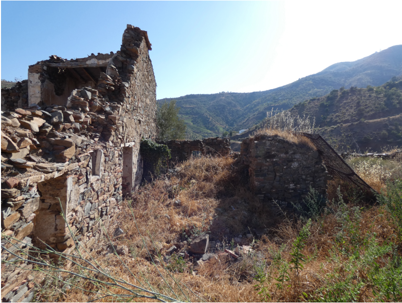
Figura 9. Lagar de Morabayte.