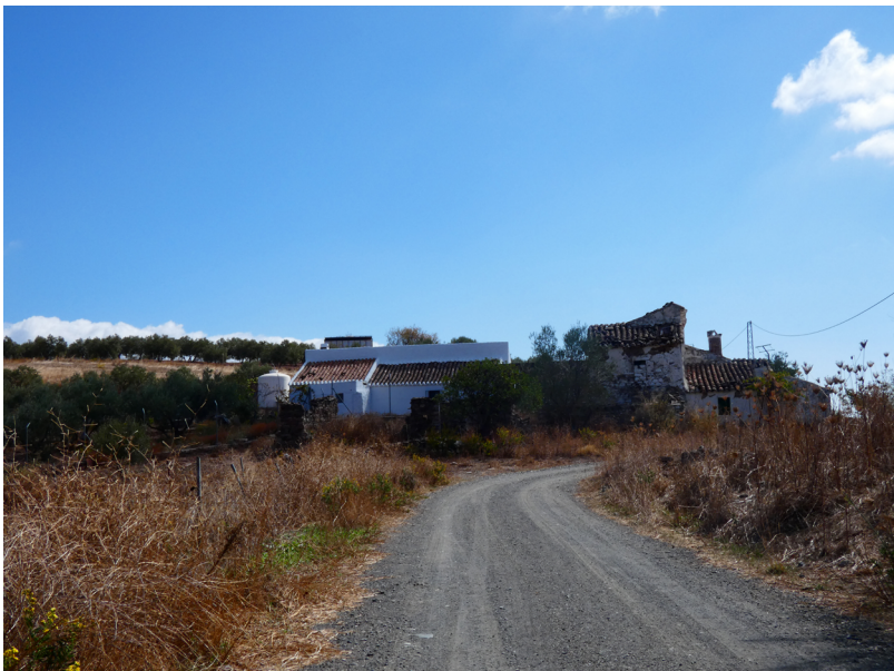
Figura 10. Cortijo de la Mezquita.

A diferencia de este último encontramos otra rābiṭa o zāwiya de la que no hay constancia toponímica, pero sí documental 131 . Se trata del cerro de la Mezquitilla,