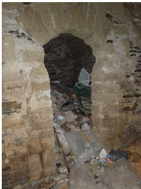
Figura 6: Interior del aljibe.