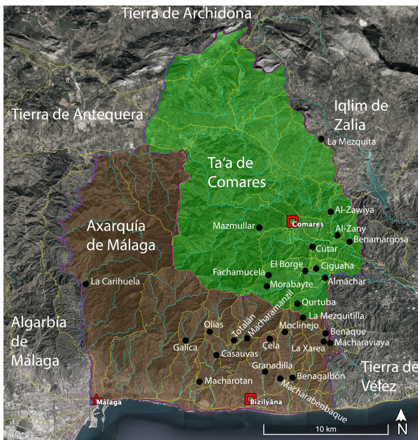
Figura 2. Localización de los edificios religiosos.

Así pues, para la elaboración de este trabajo hemos identificado cinco oratorios al aire libre, dos qībla -s, veintidós mezquitas, seis rábitas, tres zubias y cuatro edificaciones que pudieron ser rábitas o zubias (fig. 2).