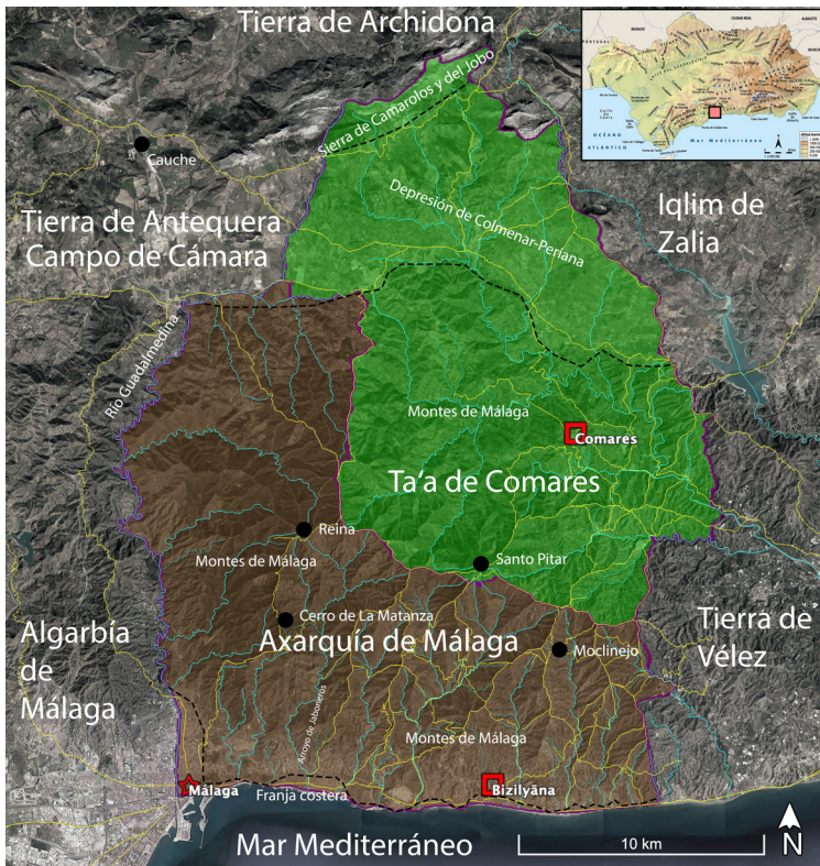
Figura 1. Ubicación de la Axarquía de Málaga y tā'a de Comares.

Cuando hablamos de la Axarquía medieval malagueña, nos referimos al antiguo sector oriental de la tierra de Málaga y no la actual comarca que ocupa todo el este de la provincia. La Sarqiyya de Málaga era un espacio geográfico que lindaba al norte con la sierra de Camarolos, al sur con el mar Mediterráneo, al este con la tierra de Vélez y el iq̄līm de Zalia y al oeste con el río Guadalmedina, este último eje delimitador respecto a la Garbiyya . En dicha Axarquía introducimos la tā'a de Comares, un amplio distrito constituido en el siglo XIV y que formaba parte de la tierra oriental malacitana. El medio físico preponderante son los Montes de Málaga que ocupa casi todo el territorio y en menor medida el corredor de Colmenar-Periana al norte-noreste, espacio de tierras calmas (fig. 1).