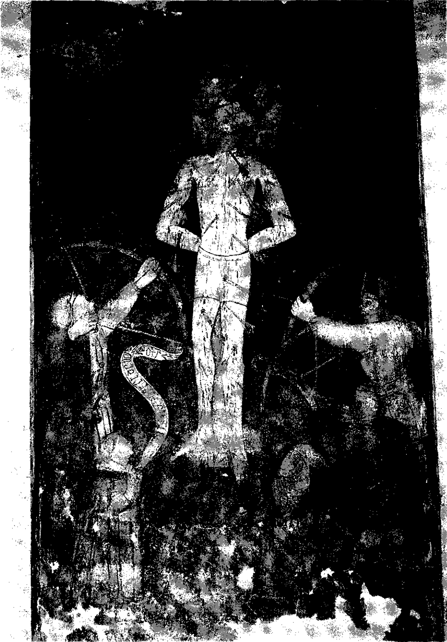
Fig. 2.— Camarm de esteruelas. Iglesia parroquial. Abside. San Sebastián.