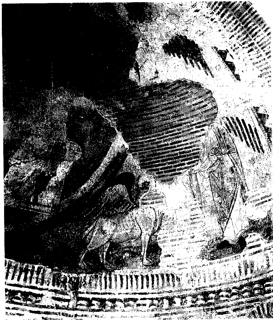
Fig. 1.—Valdilecha. Iglesia parroquial. Detalle del ábside.