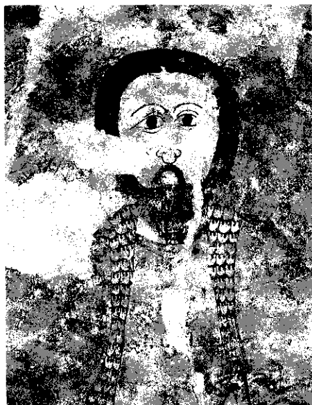
Fig. 3.—Camarma de Esteruelas. Iglesia parroquial. Abside Pantocrator.