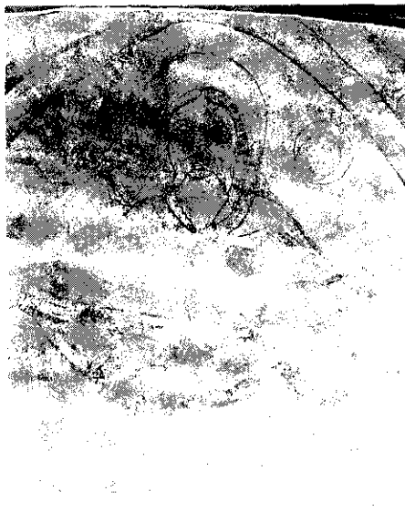
Fig. 4.—Torremocha del Jarama. Iglesia parroquial. Abside. Dios Padre.