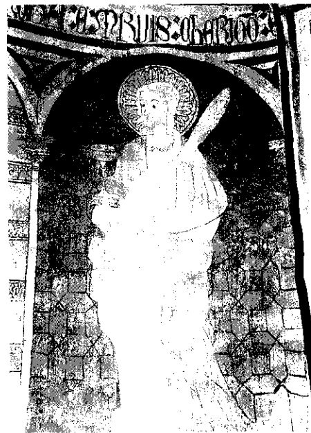
Figs. 5 y 6.—Torremocha del Jarama. Iglesia Parroquial. Abside. Apóstol y Santa Lucía.