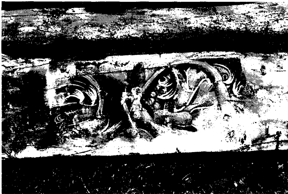
Fig. 1.—Wamba (Valladolid). Iglesia de Santa María. Viga del techo de la sacristía.