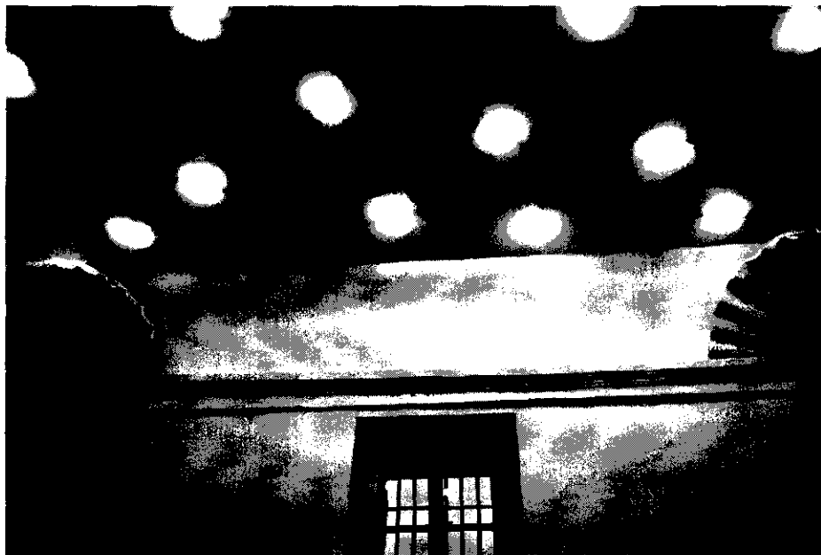
Fig. 3.—Wamba (Valladolid). Iglesia de Santa María. Techo actual de la sacristía.