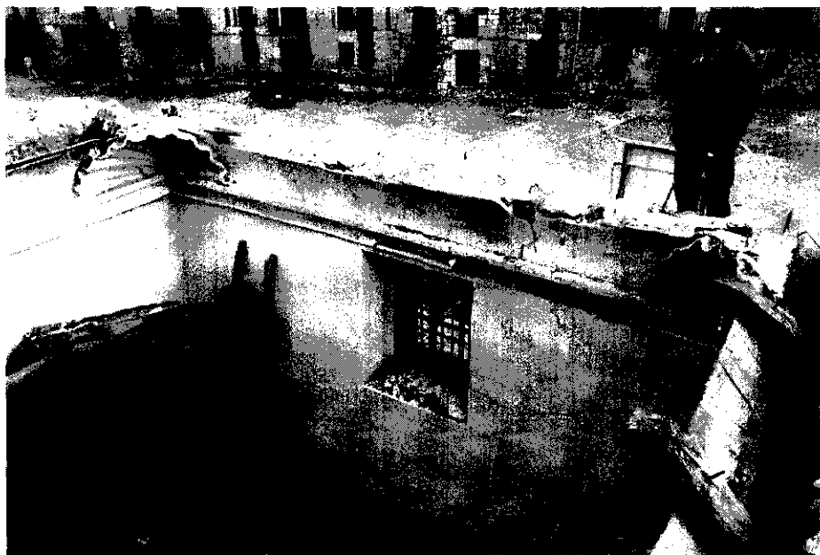
Fig. 2.—Wamba (Valladolid). Iglesia de Santa María. Restauración de techo de la sacristía.