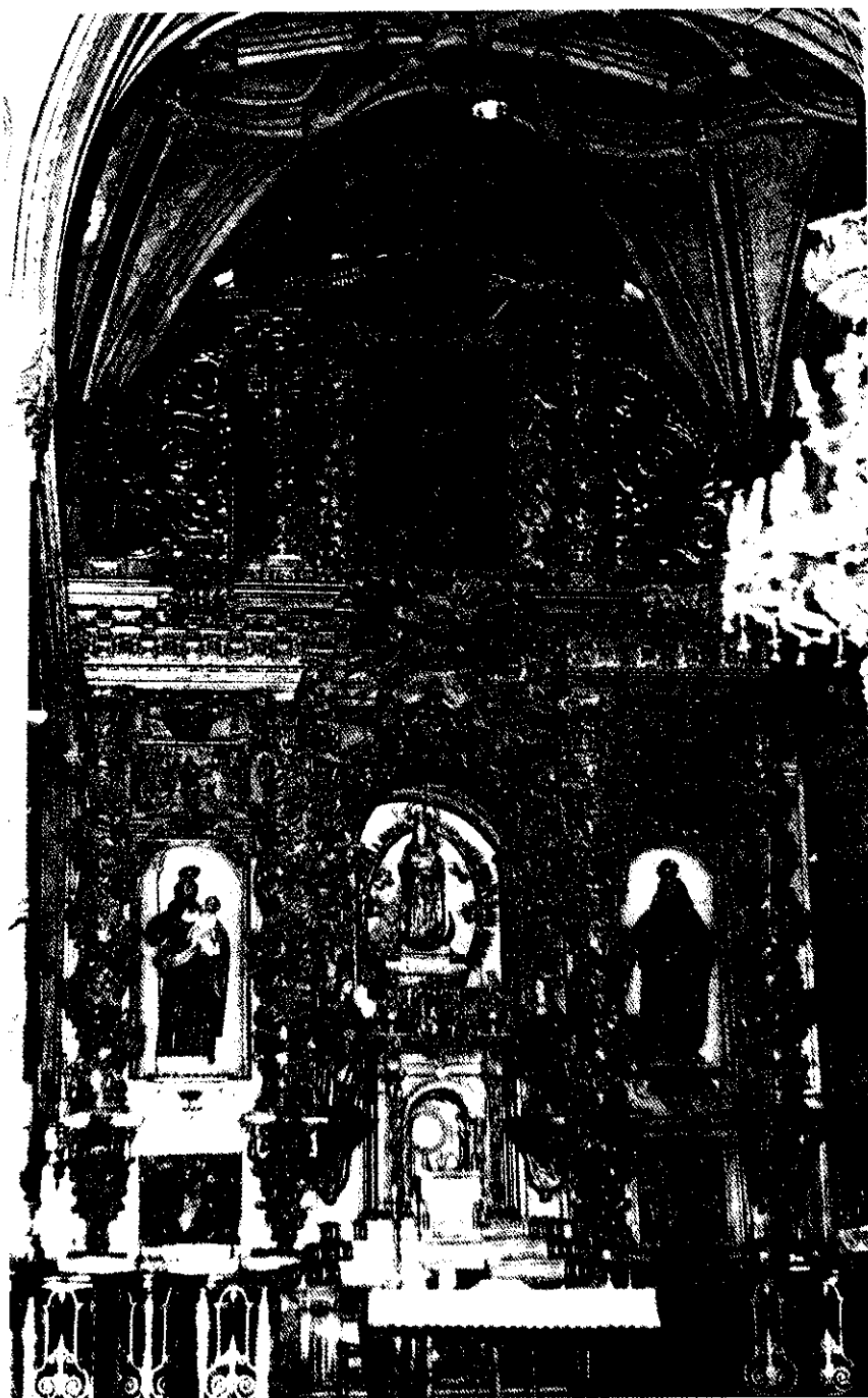
Salamanca.—Iglesia de San Julián y Santa Basilisa: retablo mayor.