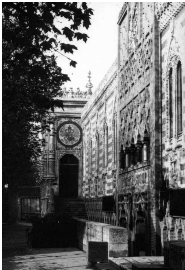
Fig. 3. Arturo Mérida, Pabellón español en la Exposición Universal de París de 1889 (París), 1889, vista exterior (demolido).

arquitectura hispanoflamenca, y en concreto la de Guas y San Juan de los Reyes, sigue siendo la más destacada de las tres. En este caso el estilo de Guas estaría representado por los dos cuerpos a uno y otro lado de la sección central formados por una galería de arcos apuntados angrelados. Se trataba de arcos geminados con sencillo parteluz moldurado. El espacio restante entre la clave del arco mayor y la de los menores estaba decorado con dos boceses que arrancaban del centro del primero para acabar en semicírculo sobre los inferiores. Motivo que, como apunta Bueno Fidel, pudo tomar prestado de la arquería superior del patio de San Gregorio de Valladolid 29 . Bajo cada ventana aparecían figuras en altorrelieve representado heraldos con los escudos de armas de los diferentes reinos de España. Mérida aprovechó otros elementos de la