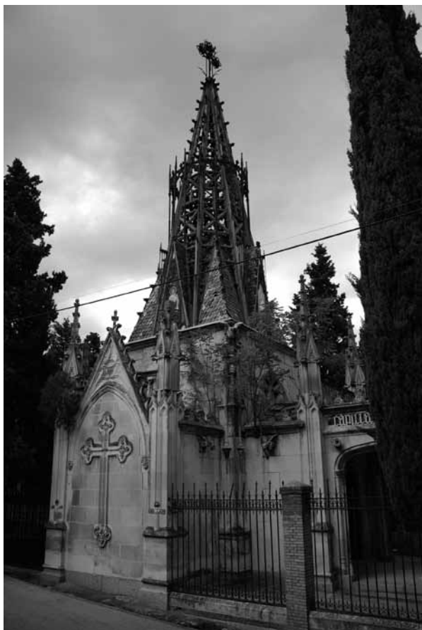
Fig. 2. Arturo Mérida, Capilla panteón de los marqueses de Amboage en el Cementerio de San Isidro (Madrid), 1888, vista exterior.

Un año después de iniciar la restauración de San Juan de los Reyes, en 1882, Mérida organizó y construyó los pabellones para la Exposición de Ganados celebradas en los jardines del Retiro de Madrid y para ello utilizó, según el profesor Navascués, el estilo gótico-mudéjar isabelino 25 . Se trataba de pabellones amplios y diáfanos destacando el dedicado a Alfonso XII, muy vistoso y colorista por la incorporación de cerámica vidriada en sus partes ornamentales.