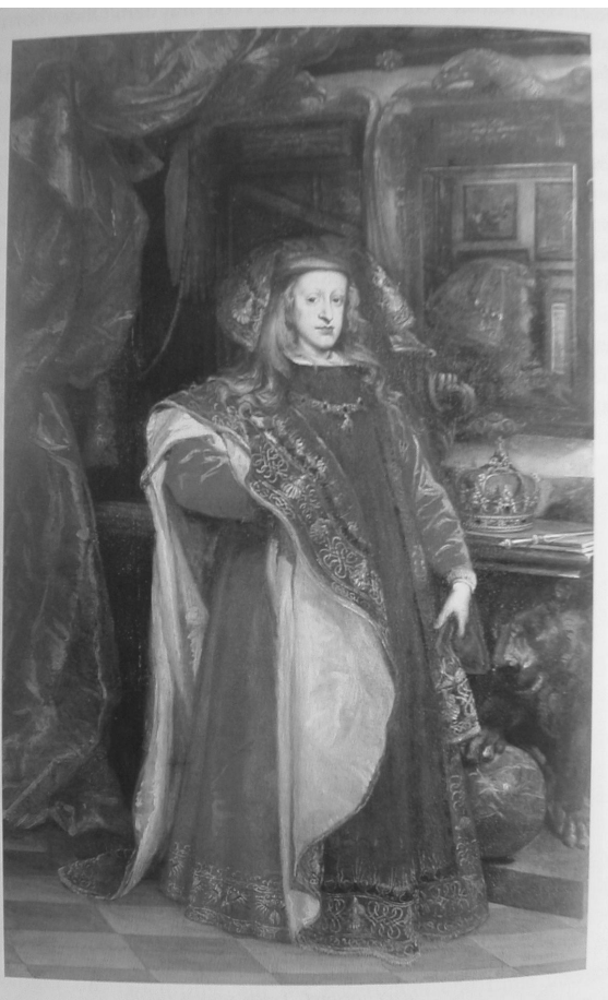
Fig. 3. Carreño de Miranda: Rey Carlos II. C. H.