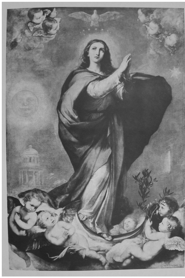
Fig. 2. José de Ribera: Inmaculada Concepción. C. H.