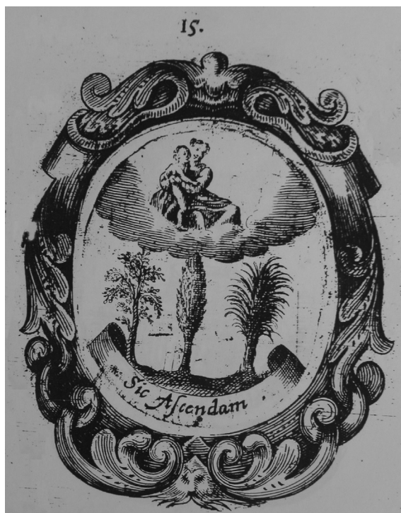
Fig. 10. Triumphus ....Emblema num. 15