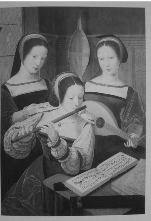
Fig. 1. Tres mujeres tocando música.