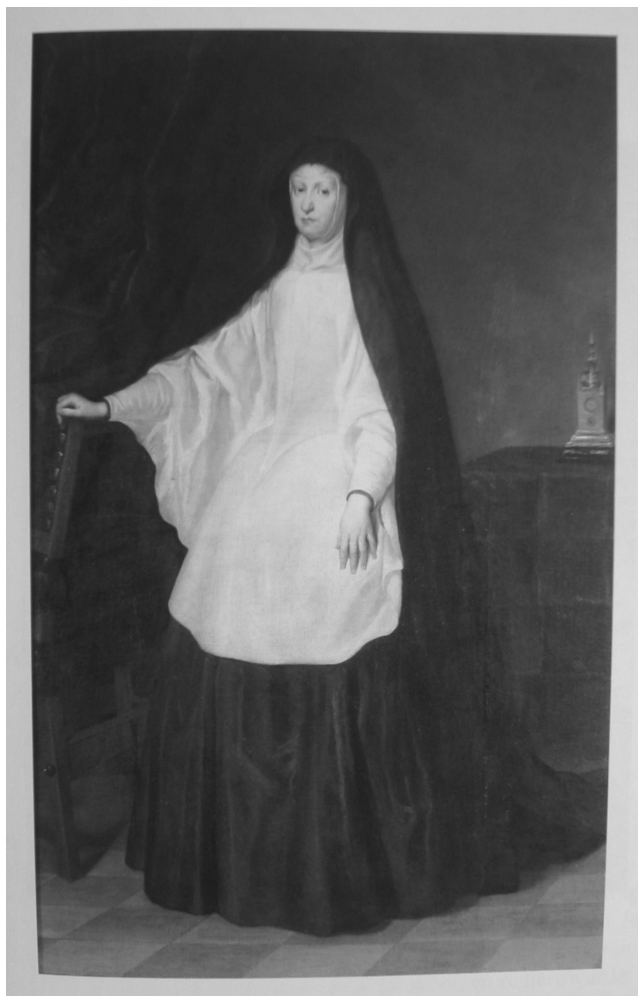
Fig. 4. Carreño de Miranda: Reina Mariana. C. H.