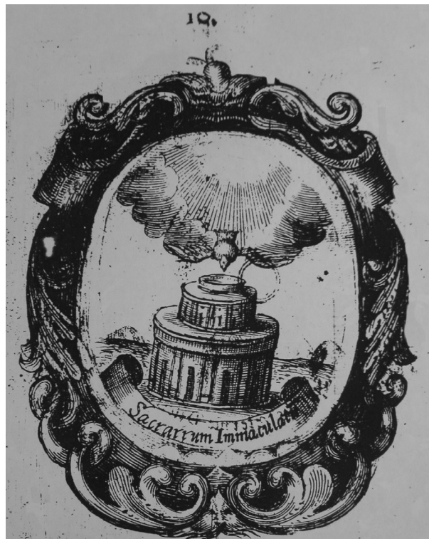
Fig. 8. Triumphus in mortem cardinalis ab Harrach. B. N. Austria. Emblema num. 10