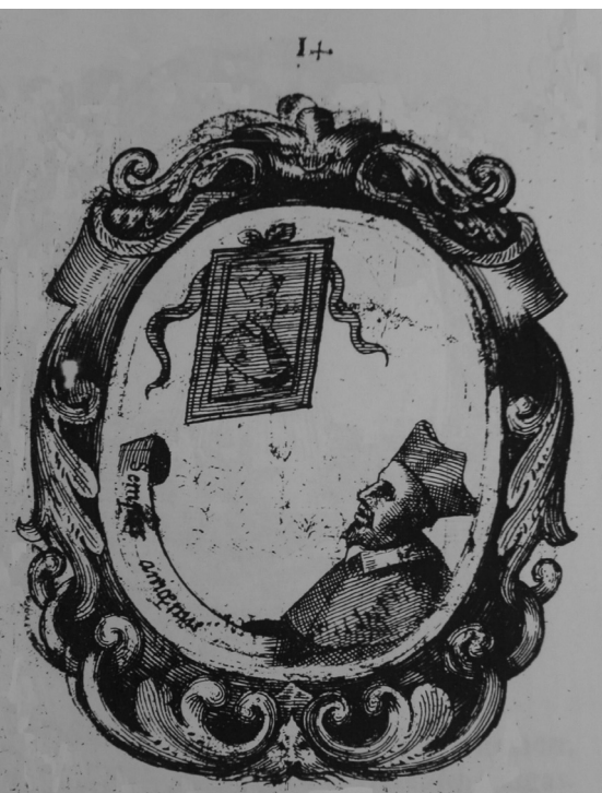
Fig. 9. Triumphus ....Emblema num. 14