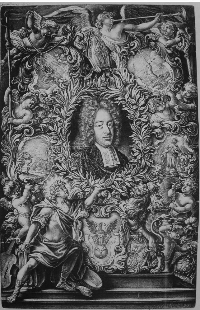
Fig. 7. Triumphus... Grabado del Cardenal Harrach