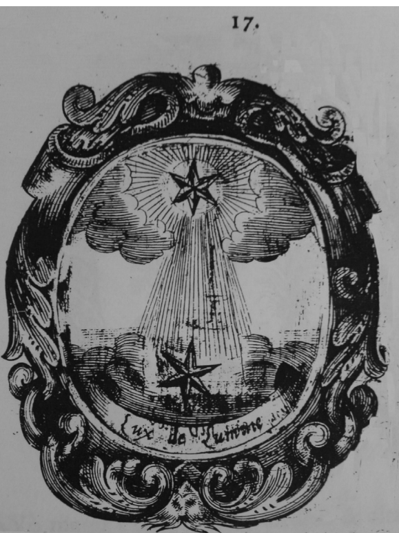
Fig. 11. Triumphus ....Emblema num. 17