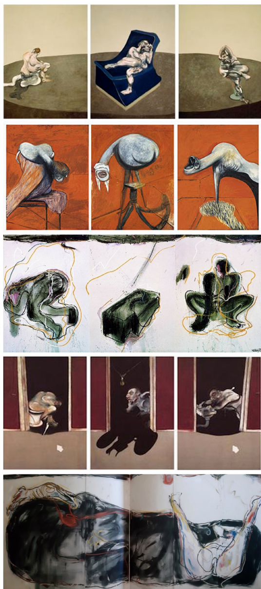
Figura 8. Composición comparada de trípticos de Bacon y Vostell citados.

de los márgenes se deshacen a la manera en que surgen secreciones en las pinturas del ciclo de Juana la Loca, o The black Tryptich 1973 (1973; en colección privada), donde la mancha negra central parece expandirse tanto que ocupa por completo el centro de Más agua , o, en lo que se refiere a los picos de ave, Three Studies for Figures as the base of a Crucifixion (circa 1944; Tate Britain Gallery, London), por citar tres ejemplos, si bien es preciso remarcar que, frente a la militancia homosexual de Bacon, la perspectiva heterosexual es dominante en Vostell (fig. 8).