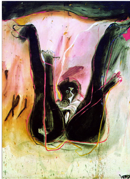
Figura 2. Pajarillos gozando en el campo el amor y la libertad . Colección particular.

tendida sobre un almohadón de acuerdo con los cánones modernos de la iconografía de una Venus que ha perdido su condición de deidad mitológica a partir de La Maja Desnuda de Goya o de la Olimpia de Manet (pintura en la que la mujer desnuda aparece acompañada por una sirvienta con aspecto de mulata). El título resulta provocador, por cuanto los cinco sentidos que se aprecian no se corresponden con las capacidades de relación con el exterior características del ser humano –de hecho, la figura carece de brazos y de orejas–, sino con cinco referentes de su carnalidad erótica: la vulva abierta, los dos pechos y los dos muslos que dominan la composición de las piernas. La presencia de líneas confiere temblor a la imagen al igual que unas pequeñas manchas de color denotan la presencia de secreciones. Se trata de una mujer que espera un encuentro sexual que no se va a producir, tema que casa perfectamente con el objeto del ciclo como una primera caracterización de la locura de una Juana en duelo por la muerte de su esposo. Vostell propone una radiografía del deseo ensimismado que no logra consumarse.