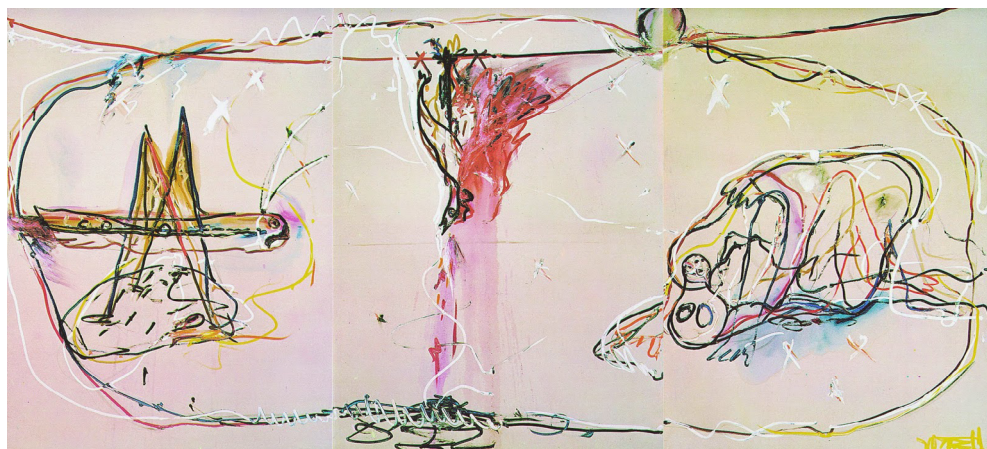
Figura 6. Mis peines son de azúcar . Berlinische Galerie, Berlín.

esbozada entre líneas en el magma oscuro. La lectura política que se intuye en Goya se ve así trasladada por Vostell a la historia de una España y una Alemania que permanecieron unidas por la figura del emperador hijo de Juana.