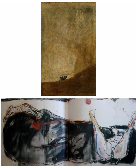
Figura 7. Perro semihundido , Francisco de Goya, 1820-1823, (Museo Nacional del Prado, Madrid) y tríptico Más agua .

En varios momentos hemos citado la influencia de Goya, sea directa o a través de ciclos previos como el dedicado a La quinta del sordo (1975), o de obras basadas en el grabado Los desastres de la guerra (1972-1973), y otras ya con posterioridad a 1980. Entre las pinturas de Goya, probablemente la más importante para entender el tríptico Más agua sea El perro , de La quinta del sordo , pues de hecho en los trazos semiborrosos del cuerpo central del tríptico de Vostell se aprecian contornos que podrían ser caninos, los del perro hundido.