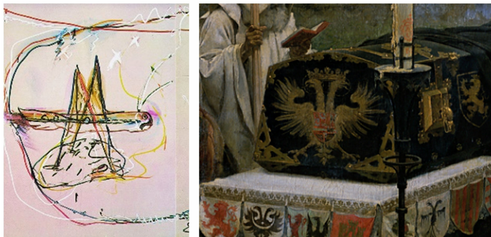
Figura 11. Composición de fragmentos del tríptico Mis peines son de azúcar y del cuadro Doña Juana la Loca , de Pradilla.

De igual forma, hemos señalado ya la relación entre la figura geométrica de la izquierda y el féretro de Felipe el Hermoso en el lienzo de Pradilla (fig. 11).