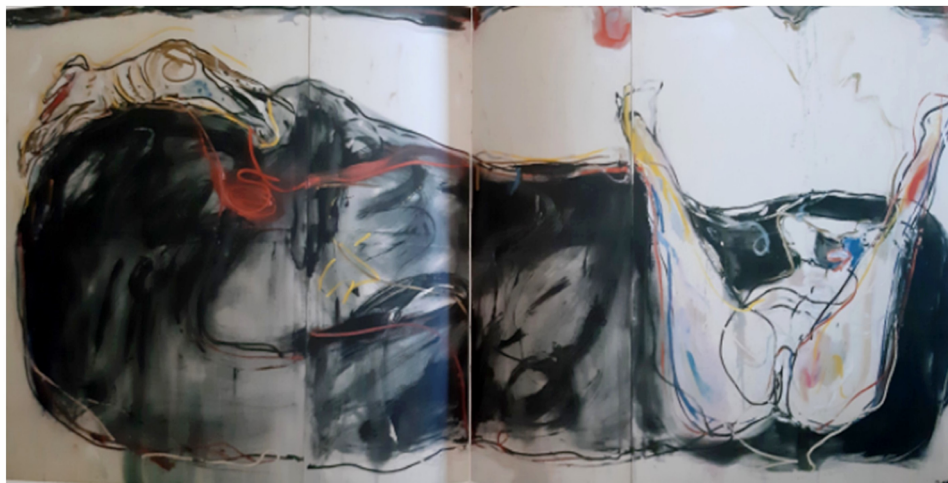
Figura 5. Más agua . Colección Gino Di Maggio. Fondazione Mudima, Milano.

imaginario sobre el encerramiento como forma de estancamiento vital 17 . Evidentemente, en el marco del ciclo objeto de análisis, el ataúd se relaciona con el de Felipe el Hermoso. De esta manera, sexo y muerte se presentan como representaciones que se funden en la figura de Juana la Loca.