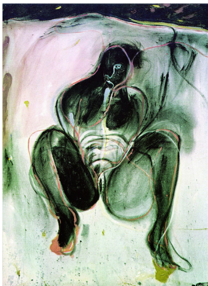
Figura 1. En mi querer tengo puestos los cinco sentidos . Colección particular.

Por otra parte, es evidente que, en lo que se refiere a las pinturas, ciertamente los tres cuadros de formato menor replican secciones de dos de los tres trípticos o pinturas de formato mayor. A su vez, estos son muy diferentes entre sí, de forma que se puede decir que abordan aspectos temáticamente diferentes. Tales aspectos han de descubrirse a través de los elementos iconográficos de la poética vostelliana y, sobre todo, a partir de una idea que permite la interacción entre las pinturas: la de metamorfosis o transformación.