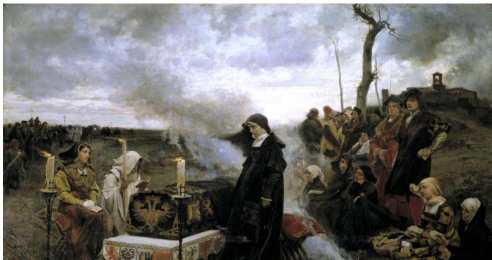
Figura 9. Doña Juana la Loca , Francisco Pradilla, 1877. Museo Nacional del Prado, Madrid.

Ahora bien, entre Goya y Bacon, Vostell reconoce la iconografía de la reina Juana en la pintura historicista española en una serie de seis pinturas de estética nítidamente academicista obra de Francisco Pradilla y Ortiz (1848-1921) y, más concretamente, con una de ellas como su referente más universal. Se trata del cuadro que hemos citado en un párrafo previo y que lleva precisamente el título de Doña Juana la Loca (Museo del Prado, Madrid), pintura del año 1877 (fig. 9) que aparece en cualquier documentación contemporánea acerca de la figura de la reina Juana, en la cual se retrata con efectismo y romanticismo un episodio de la peregrinación fúnebre a través de Castilla en el que la comitiva se detuvo ante un convento de monjas para velar el cadáver al raso, sin compartirlo con otras mujeres y menos aun con religiosas 20 .