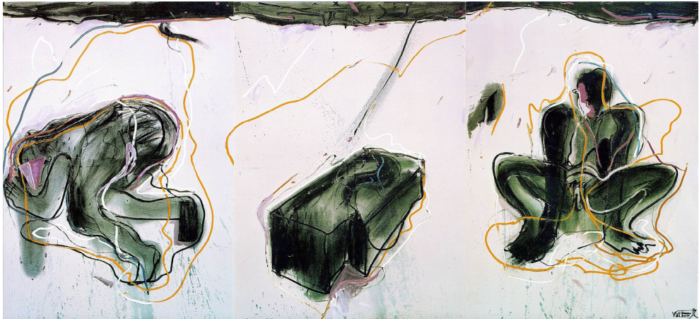
Figura 4. Las cositas del querer están llenas de misterio. Sammlung Michael J. Wewerka, Berlín.

les. El contexto también se puede interpretar a partir de la iconografía de Narciso, con la mujer ahogándose no tanto por estar enamorada de sí misma, sino por no ser correspondida físicamente por alguien externa a ella. De esta manera, el deseo adopta una forma magmática a la vez que absorta en sí misma, lo cual conduce al desvarío. La declaración de locura parece culminar el proceso de los tres cuadros, tras uno primero dedicado al deseo sin posibilidad de contacto humano y un segundo que plantea la hipótesis de una relación sexual con un cadáver.