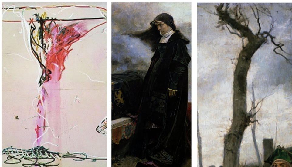
Figura 10. Composición de fragmentos del tríptico Mis peines son de azúcar y del cuadro Doña Juana la Loca , de Pradilla.

De igual forma, hemos señalado ya la relación entre la figura geométrica de la izquierda y el féretro de Felipe el Hermoso en el lienzo de Pradilla (fig. 11).