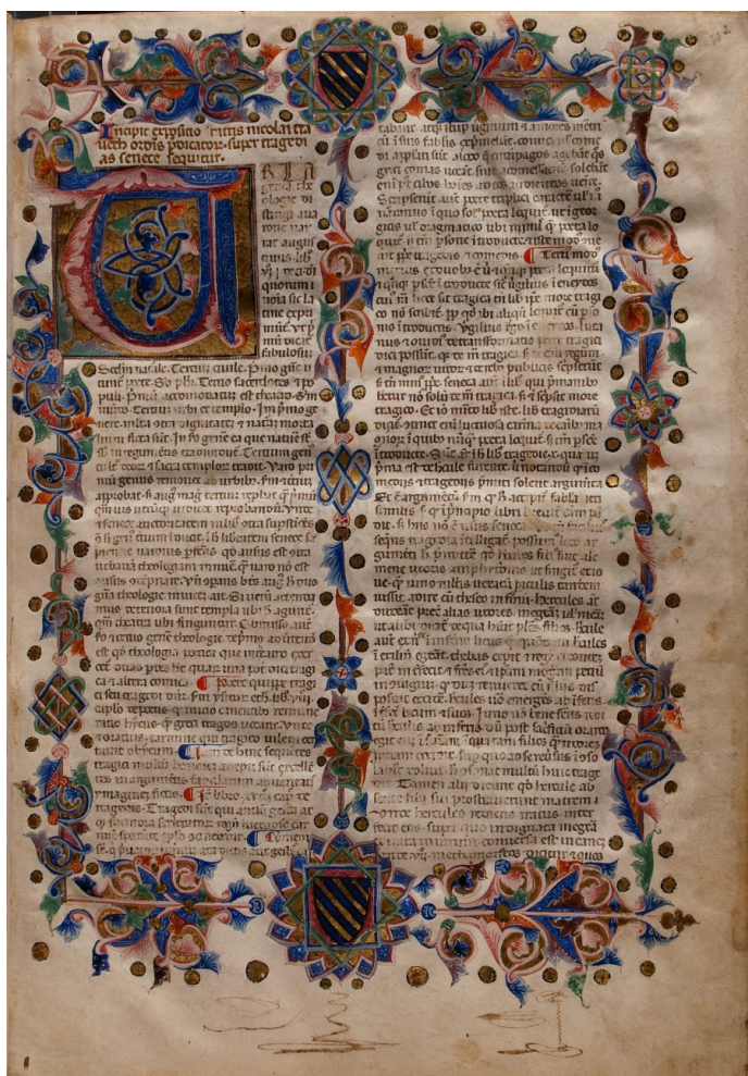
Figura 1. Salamanca, Biblioteca General Histórica, Ms. 2703, f. 2r. Orla realizada por el taller napolitano

en todas sus características codicológicas, de hecho, está formado por veinticuatro cuaterniones y un bifolio al final de la serie 59 . Sin embargo, la divergencia aparece en el repertorio miniado, donde se detectan dos etapas de ejecución claramente diferenciadas por sus elementos compositivos y rasgos formales. La primera napolitana y la segunda, y mayoritaria, de factura romana, ambas ejecutadas durante la segunda mitad del siglo XIV. El taller que recibe y comienza el encargo inicial se sitúa en un foco próximo a la corte angevina, donde están activos el equipo de Cristoforo Orimina, uno de sus máximos exponentes, o el Maestro del Salomón de la Casanataense . Todos ellos representan el complejo entramado de intercambios, de lenguajes y de formas, que se van nutriendo gracias a la circulación de bienes y personas que transitan por la Via degli Abruzzi .