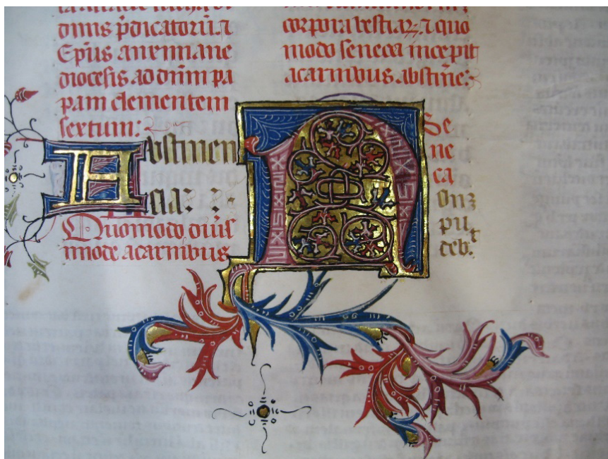
Figura 4. Salamanca, Biblioteca General Histórica, Ms. 2638, f. 5r. Detalle de las hojas laceoladas realizadas por Pedro de Toledo

El traslado de personas es un fenómeno intrínseco a la propia civilización, en definitiva, nos movemos para buscar, para encontrar otros recursos, otras realidades, otras necesidades, otra formación, otros espacios... en ocasiones, para la literatura artística más tradicional, el viaje ha constituido un lugar común a través del cual explicar determinados cambios o novedades en el ámbito local. La gran colección bartolomea no parecía explicarse de otro modo que no fuera con la salida al exterior de los colegiales, en cambio, ha quedado constatado cómo existen variados indicios que demuestran una intensa circulación libraria en la principal ciudad universitaria del reino de Castilla. Por lo tanto, conviene cambiar la perspectiva y considerar las redes de circulación y distribución libraria que tenían como destino Salamanca. De forma que, una vez reconstruido el viaje de la librería de Diego de Anaya y de su Colegio, se pueda atender a la intrahistoria de sus huellas, con el fin de comprender cómo estas fueron recibidas en territorios inicialmente ajenos; la acogida que padecieron, los cambios que indujeron, las dificultades de arraigo que sufrieron, el mestizaje cultural que provocaron y, en definitiva, la capacidad de adaptación paradójica de «lo diferente» en un espacio global.