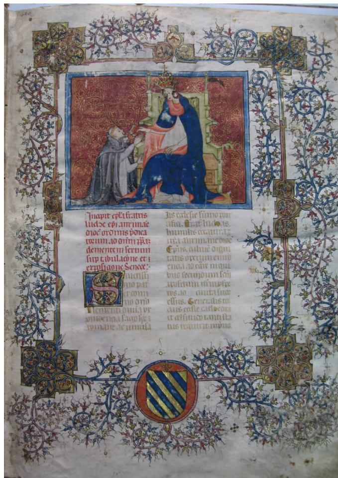
Figura 3. Salamanca, Biblioteca General Histórica, Ms. 2638, f. 1r. Orla del taller de Pedro de Toledo

con cierta facilidad que, bajo las letras iniciales iluminadas, existen otras de menor entidad y decoración afligranada 71 . Avanzar en el análisis de estos pormenores esclarecerá los detalles del proceso de materialización pero, en este momento, interesa llamar la atención sobre algunos aspectos relacionados con el repertorio icónico, cuyo responsable es el iluminador Pedro de Toledo 72 .