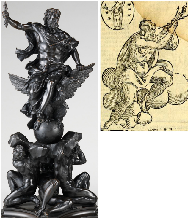
Figura 3. Alessandro Algardi. Morillo de Júpiter . Londres, Wallace Collection (izq). Vincenzo Cartari. Imagini degli Dei degli Antichi (1647), fol. 83 (der).