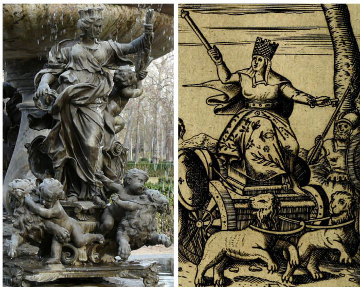
Figura 6. Alessandro Algardi. Morillo de Cibeles . Aranjuez, Jardín de la Isla (izq). Vincenzo Cartari. Imagini degli Dei degli Antichi (1608), fol. 192 (der).