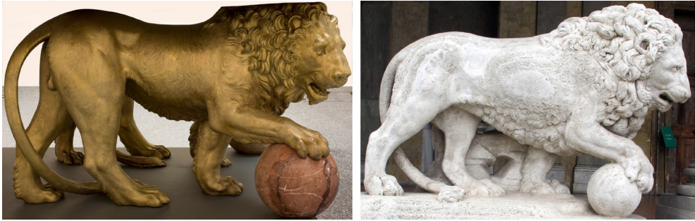
Figura 1. Matteo Bonucelli. León . Museo Nacional del Prado (izq). León . Loggia dei Lanzi, Florencia (der).

de Morales enviarle 2.000 ducados para continuar las obras. El 6 reiteró Córdoba el envío de fondos porque la semana siguiente comenzarían a dorar los leones. El 27 escribía Finelli al virrey dándole a conocer que había empezado el dorado de dos leones, que eran “machina grandi” sin precedentes en Roma y que precisaba dinero para pagar oficiales, pues, de otro modo, él estaría ahí perdiendo el tiempo. El 10 de marzo, tras recibir Córdoba dos letras con los socorros pedidos, informó que, en dos días, partían las obras de Roma hacia Nápoles en barco acompañadas por Finelli 12 . Al día siguiente contrató Córdoba el transporte embarcándose 44 cajas grandes y medianas en las que iban, entre otras cosas, los dos leones de bronce 13 .