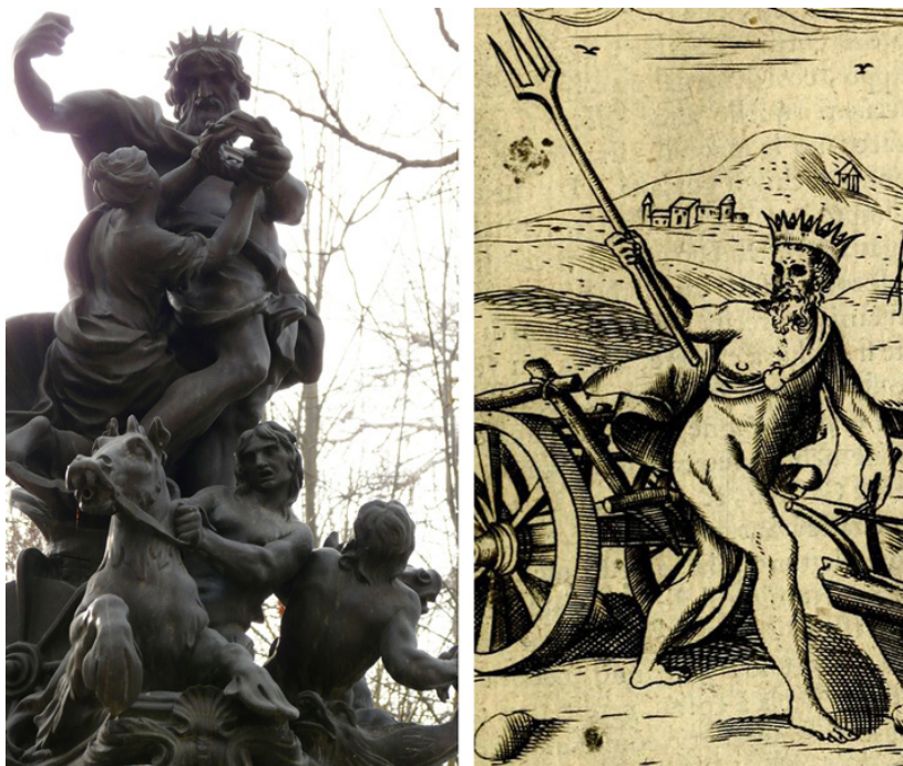
Figura 7. Alessandro Algardi. Morillo de Neptuno . Aranjuez, Jardín de la Isla (detalle, izq). Vincenzo Cartari. Imagini degli Dei degli Antichi (1608), fol. 238 (der).