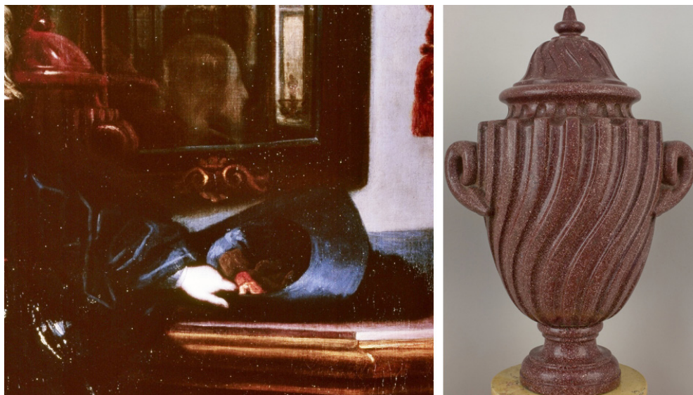
Figura 2. Juan Carreño de Miranda. Carlos II . Museo Nacional del Prado (detalle, izq). Vaso . Museo Nacional del Prado (der).

Se conserva un ejemplar de estos vasos en el Museo del Prado (O00495). Mide 86 x 58 cm y aparece en los retratos de Carlos II de Carreño (Fig. 2) 44 ; el otro bufete de este testero tendría el otro ejemplar idéntico. Recibieron una alta valoración debida a su peso (135 kg el conservado) y la dificultad del trabajo por la dureza del material, de gran riqueza e inusual en España.