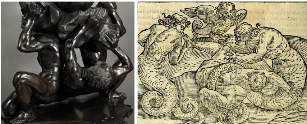
Figura 4. Alessandro Algardi. Morillo de Juno . Londres, Wallace Collection (detalle, izq). Vincenzo Cartari. Imagini degli Dei degli Antichi (1608), fol. 156 (der).