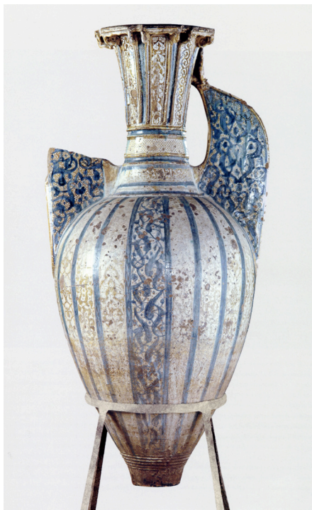
Fig. 7. Jarrón de la Alhambra hallado en Hornos. Loza estannífera decorada en azul de cobalto y reflejo metálico. Museo Arqueológico Nacional, Madrid.

otras piezas. Otro núcleo, cuya producción se centra antes del 1118, se ha identificado en Zaragoza y el valle del Ebro, siendo el posible origen de talleres regionales mudéjares que producen a lo largo del s. XII. A partir de estas fechas la arqueología ha evidenciado otros alfares en Almería, Málaga, Granada, Murcia, Cieza, Mértola o Calatrava 69 y son bien conocidas las citas de al-Idrisi (m. 1164-1165), al-Zuhri (s. XII), al Himyarí (m. 1326), Ibn Said (1213-1286), al-Maqqarī, al-Umarī y Ibn Fadl Allāh (1337), Ibn Batūta (1356), Ibn al-Jatib (1313-1374) que hablan de loza dorada andalusí.