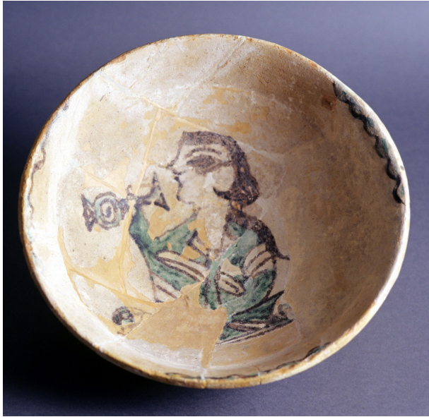
Fig. 3. Cuenco con vidriado estannífero hallado en Benetússer que representa un príncipe bebiendo, inicios del s. XI. Depósito del Ayuntamiento de Benetússer en el Museo Nacional de Cerámica.

mediterránea desde Torre de la Sal hasta la costa murciana y también se documentan en Pisa como objetos emblemáticos al ser colocados en la fachada de la iglesia de San Piero a Grado antes del 1048 49 . Denia fue conquistada por el rey taifa de Zaragoza en 1076, un importante espacio político surgido bajo la hegemonía de los Banū Tuyibī (1010-1040) continuado posteriormente por los Banū Hūd (1040-1110), pero la difusión de las ciudades productoras de estas lozas como centros hegemónicos o dependientes prosiguió hasta el dominio de al-Andalus por los almorávides que, por otra parte, nunca eliminaron la producción de esta técnica aunque cambiaron su nivel de representación al desproveerla de valor decorativo.