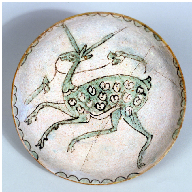
Fig. 2. Cuenco con vidriado estannífero que representa un cervatillo, s. X. Museo Nacional de Cerámica, inv. CE1/02858.

La iconografía desarrollada en estas producciones presenta epigráficos como al-mulk , al'yumn o baraka (Fig. 1), la representación de temas asociados al Paraíso como los cuatro ríos, la flora, zoomorfos o antropomorfos evocadores de sus placeres –caballos, liebres, cervatillos (Fig. 2), gacelas, aves–, príncipes cazando o bebiendo (Fig. 3), o abstractos como el trenzado o nudo de la Eternidad. Debemos ver en ella la vinculación con el arte oficial, plasmado a través de estereotipos formales que de alguna manera definen ya una escuela estética y que se aplican indistintamente sobre pintura mural, miniatura, orfebrería, vidrio, tejido, o cualquier producción de elevada consideración social.