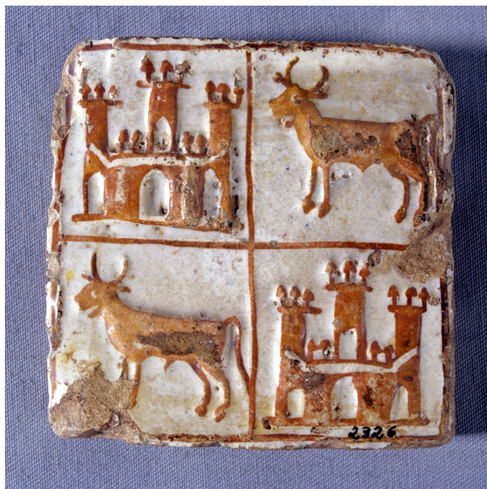
Fig. 9. Azulejo estannífero con reflejo metálico, con el escudo de la familia Boil, señores de Manises. Museo Nacional de Cerámica, inv. CE1/02326.

como los vasos de la Alhambra que de ese modo llegaron a Sicilia (Mazzara del Vallo o Palermo) (Fig. 7) y a Fustat 74 . La loza dorada valenciana alcanzará una gran difusión en el s. XIV, especialmente la de Manises, como recuerda fra Francesc Eimenis en su Regiment de la Cosa Pública , en 1383. Pero será en el s. XV cuando la loza dorada se convertirá en un elemento codiciado en los reinos cristianos de Europa y será usada como soporte emblemático de instituciones (Fig. 8), individuos poderosos (Fig. 9), ricos mercaderes y prelados cuya heráldica presidirá los propios platos, tarros o jarrones. Así, desde hasta la reina María de Castilla o Alfonso el Magnánimo, Felipe el Bueno de Borgoña (Fig. 10), el delfín de Francia, Blanca de Anjou, los Reyes Católicos, y también numerosos mercaderes toscanos o Piero il Gotoso Medici, entre muchos otros, gozarán del privilegio de disponer en su aparadores de grandes platos de loza dorada de Manises, pero eso será poco antes de que llegue su declive provocado por la calidad, novedad y pujanza de la loza policroma renacentista italiana 75 .