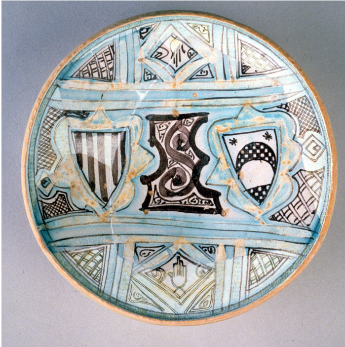
Fig. 4. Plato de Paterna, de producción mudéjar, con vidriado estannífero, que presenta los emblemas de Aragón y Luna alusivos al enlace matrimonial de Violante de Aragón con el conde Lope de Luna (1339). Museo Nacional de Cerámica, inv. CE1/00645.

sobre la misma pieza, yuxtapuestos y separados por una línea pintada de manganeso sin vidriar. En ellas solemos encontrar esmaltes de estaño junto a otros de plomo e incluso pigmentaciones que utilizan óxidos metálicos vertidos en masa en ambas bases. Ello hace que el ajuste en los puntos de fusión de las diferentes preparaciones vidriadas sea crítico confiriéndoles un valor singular. Por su parte, la fabricación de la cuerda seca total pertenece ya al s. XI, cuando alcanza su mayor calidad técnica.