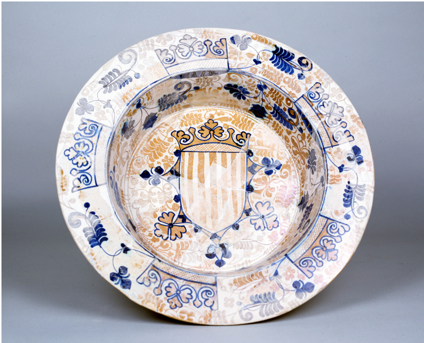
Fig. 8. Plato hondo, loza estannífera decorada en azul de cobalto y reflejo metálico con el escudo del reino de Aragón. Museo Nacional de Cerámica, inv. CE1/01554.

Al-Idrisi aclara cómo se llamaba a estas lozas doradas al mencionar un “ guidār mud-hahhab ” o plato dorado, ya que guidār o al-guidār , como en portugués, y tabak , son los vocablos andalusíes documentados por fuentes escritas referidos a este objeto 71 .