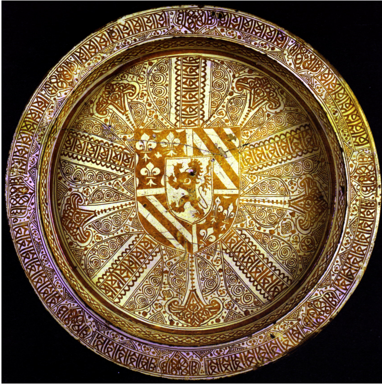
Fig. 10. Gran bandeja de loza estannífera decorada en reflejo metálico con el escudo de Felipe el Bueno, duque de Borgoña. Museo Lázaro Galdiano (Madrid).