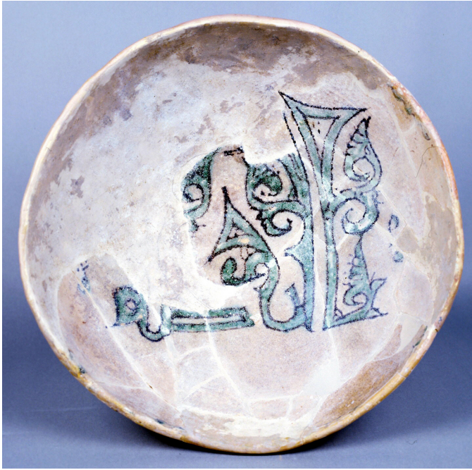
Fig. 1. Cuenco con vidriado estannífero hallado en Benetússer con inscripción Baraka , inicios del s. XI. Depósito del Ayuntamiento de Benetússer en el Museo Nacional de Cerámica.

sabemos que ello ocurrió, ya que nos encontramos con una rápida difusión de lozas estanníferas de marcado carácter regional que además comparten la iconografía fomentada desde el poder califal. Si se observan morfologías, como las fuentes de base plana y perfil cóncavo, que parecen reclamar una inspiración en la orfebrería. Sin embargo, por razones meramente técnicas, las lozas estanníferas que se producirán en los innumerables alfares de al-Andalus reproducirán masivamente, para el servicio de mesa, modelos de grandes cuencos de servicio colectivo con pie anular externo y cuerpos de desarrollo semiesférico, cónico o quebrado, así como cantarillas o jarras para beber, cántaros, orzas, tazas, etc., siendo la loza estannífera de Madīnat al-Zāhira el paradigma del periodo 46 . El camino que siguió la técnica hasta llegar a al-Andalus no parece oscuro. Raqqada, en Túnez, fabricó con seguridad loza estannífera ya en el s. IX 47 . De hecho la Gran Mezquita de Qayrawan se decoró, entre 856 y 863, con azulejos de loza dorada, algunos importados y otros fabricados localmente por un artesano iraquí 48 .