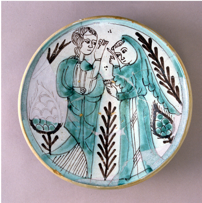
Fig. 5. Plato de Paterna, de producción mudéjar, con vidriado estannífero y representaciones humanas. Museo Nacional de Cerámica, inv. CE1/00648.

dicos, como los Aragón y Luna en Paterna (Fig. 4), o en Teruel 55 . Las decoraciones cristianas de los siglos XIII y XIV ofrecen temas de repertorio seriado, de carácter abstracto, con trazos paralelos, estrellas cenefas de eses, etc., y series con motivos que reproducen fielmente las decoraciones formales de artesanados, pintura parietal, miniatura o retablistica, lo que hace pensar en que debieron trabajar en su ornamentación dos tipos de agentes: por un lado los alfareros y por otro dibujantes formados en claves estilísticas capaces de trazar a partir de modelos consensuados en una estética de carácter oficial formalizada aplicable a todo tipo de soporte. No se nos escapa este aspecto cuando vemos la calidad pictórica de los personajes representados en la loza verde y negra de Teruel, Paterna (Fig. 5) o Manises y la similitud que se aprecia con la ornamentación de artesanados como los de la Catedral de Teruel o la iglesia de la Sangre de Liria.