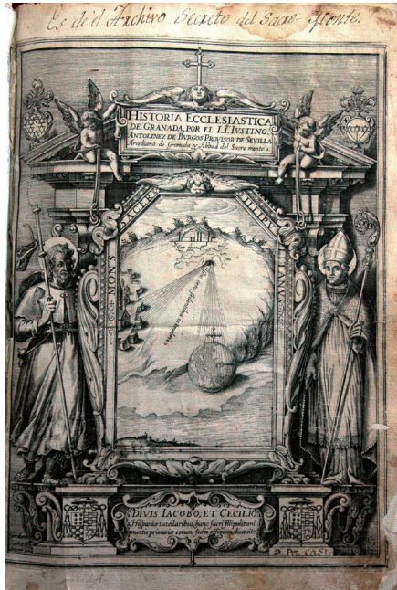
Fig. 2. Francisco Heylan, Portada arquitectónica: Santiago Apóstol, San Cecilio y las cavernas del Sacro Monte iluminando el orbe católico . Talla dulce, 1611, [Girolamo Lucēte invent. / F. Heylan Sculp.]. Huella 270 x 198 mm. En: ANTOLÍNEZ, Justino: Historia Eclesiástica de Granada . Manuscrito, 1610. © MASM. C-2.

La llegada de Francisco Heylan a Granada en 1611, se ha venido vinculando tradicionalmente 34 , al encargo que el flamenco recibió por parte de Justino Antolínez, Provisor y mano derecha del arzobispo de Granada Don Pedro de Castro, para la ilustración de su Historia Eclesiástica de Granada 35 (fig. 2).