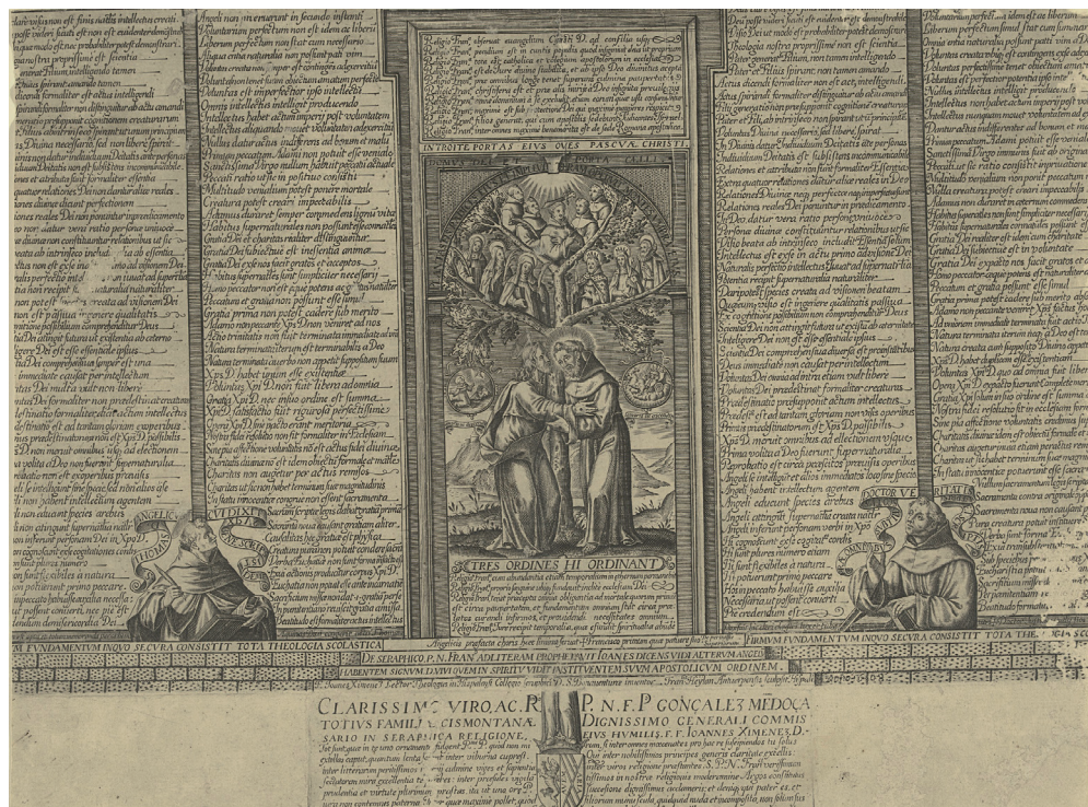
Fig. 1. Francisco Heylan, El abrazo de Cristo y San Francisco, y el árbol de la Familia Franciscana . Talla dulce, 1608, [F. Joanes Ximénez Lector Theologus in Hispalensi Collegio Seraphici D.S. Bonaventurae inuentor / Fran us Heylan Antuerpensis sculpsit Hispali anno 1608]. Hoja 297 x 399 mm. RP-P-1878-A-1034.

Sin embargo se debe señalar que en 1612, año en el que encontramos plenamente establecido a Francisco en Granada, encontramos cinco estampas más publicadas en impresos sevillanos. Este hecho nos lleva a preguntarnos ¿si dichas matrices fueron abiertas en Granada o en Sevilla? O en su caso lleva a preguntarnos, si Francisco debió de estar un tiempo itinerante entre Sevilla y Granada. Posibilidad remota que no se debería descartar. Sin embargo, según el análisis de los datos y obras estudiadas, todo nos lleva a pensar que las planchas de estas cinco estampas pudieron ser abiertas en Granada aunque su encargo bien pudiera ser realizado cuando Francisco todavía se encontraba en Sevilla. No olvidemos que el grabador ya gozaba de un prestigio en su arte y que su traslado a la ciudad de la Alhambra no debió ser ningún obstáculo.