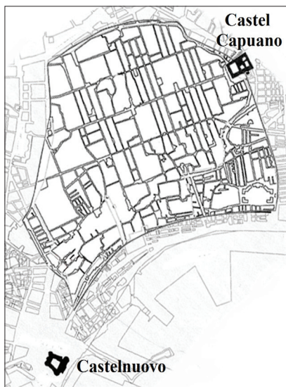
Fig. 1. Extension urbaine de Naples au XVe siècle 3 .

Dans ce paysage urbain, les deux châteaux qui sont effectivement des résidences royales, Castelnuovo et Castel Capuano, sont logiquement les plus prestigieux. Le plus ancien est Castel Capuano 4 . Edifié sur ordre du roi normand Guillaume I er , il sert de résidence royale à Naples à partir de 1160, jusqu'à ce que le roi de la nouvelle dynastie Charles I er d'Anjou décide de la construction d'un autre château, Castelnuovo, édifié entre 1279 et 1282. Couramment désigné en italien par l'expression " maschio angioino " qui signifie "donjon angevin", ce château donnant sur la baie, hors les murs de la ville, manifeste par cette situation le caractère exogène de la domination politique du royaume.