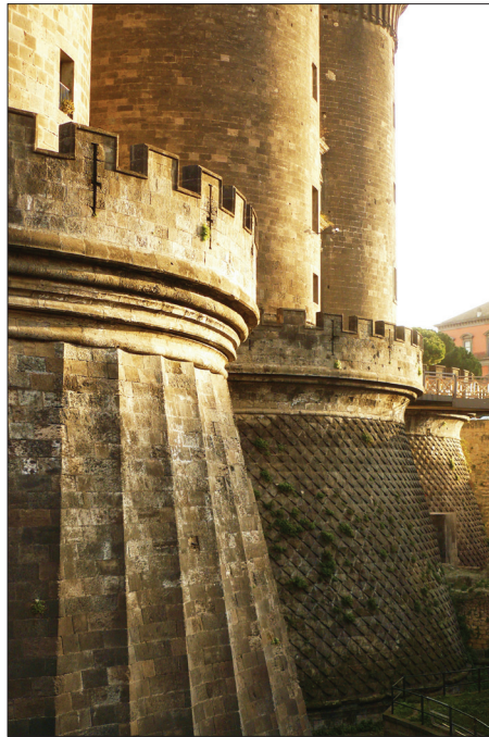
Fig. 3. La Tour di San Giorgio dite “forana” au premier plan, et les Tours di Mezzo et di guardia à l’entrée de Castelnuovo, photographie de l’auteur.