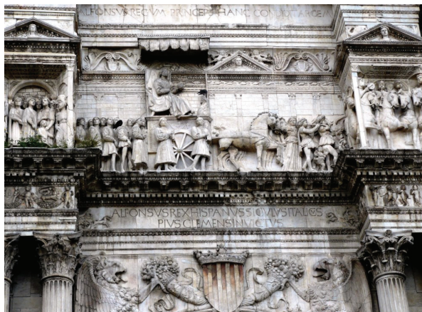
Fig. 5. L'entablement de l'arc de triomphe à l'entrée de Castelnuovo.