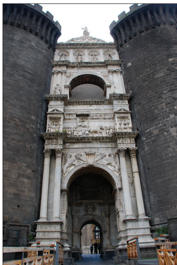
Fig. 4. L'arc de triomphe à l'entrée de Castelnuovo.

Toutefois, les espaces de prestige que sont la chapelle et la salle des barons, ou bien l'appartement royal composé des salles du Millet, du Noeud, de l'Hermine 32 (fort mal connu en l'absence de descriptions contemporaines), sont tout à fait éclipsés par l'arc de triomphe qui orne la nouvelle entrée du château. Il s'agit du fleuron de la politique de commande artistique d'Alphonse le Magnanime, et à ce titre il a concentré les commentaires savants 33 .