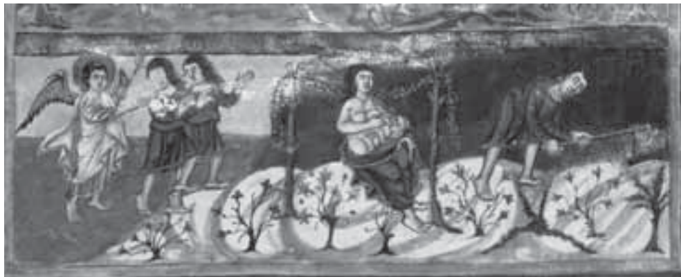
Fig. 9. Biblia de Moutier-Grandval, Tours, 840, Londres, BL, Add. 10546, f. 5v: Expulsión del Paraíso, Los trabajos de Adán y Eva.

como las figuras de apóstoles en las jambas, a las que habría pertenecido, según V. Nodar y S. Fernández, un San Pedro reutilizado en el friso de Platerías 22 .