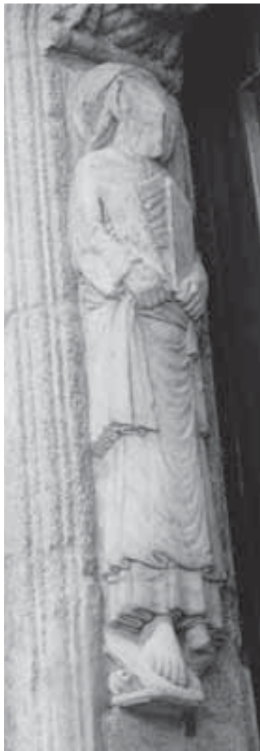
Fig. 12. Catedral de Santiago, fachada sur (Platerías), ingreso izquierdo, jamba izquierda: Maestro de las Tentaciones, Moisés, 1103-1105.