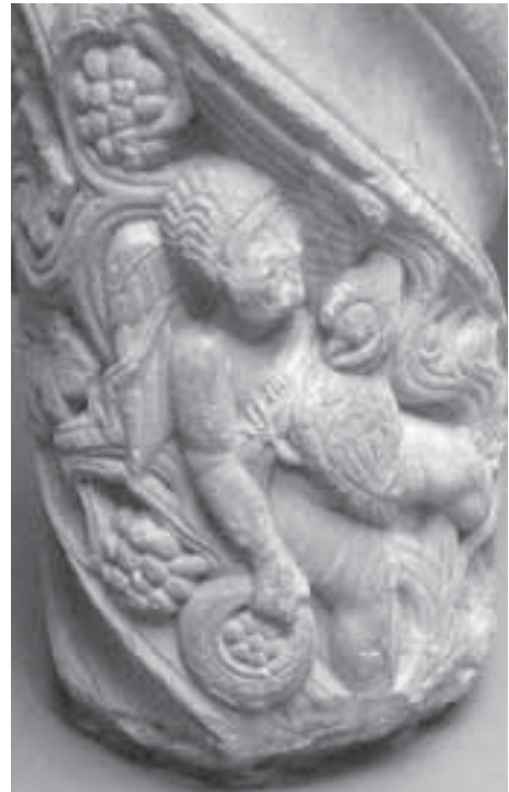
Fig. 21. Maestro de las Columnas Entorchadas: fragmento de fuste entorchado procedente de la primitiva Porta Francígena: 1101-1111. Museo da Catedral de Santiago.