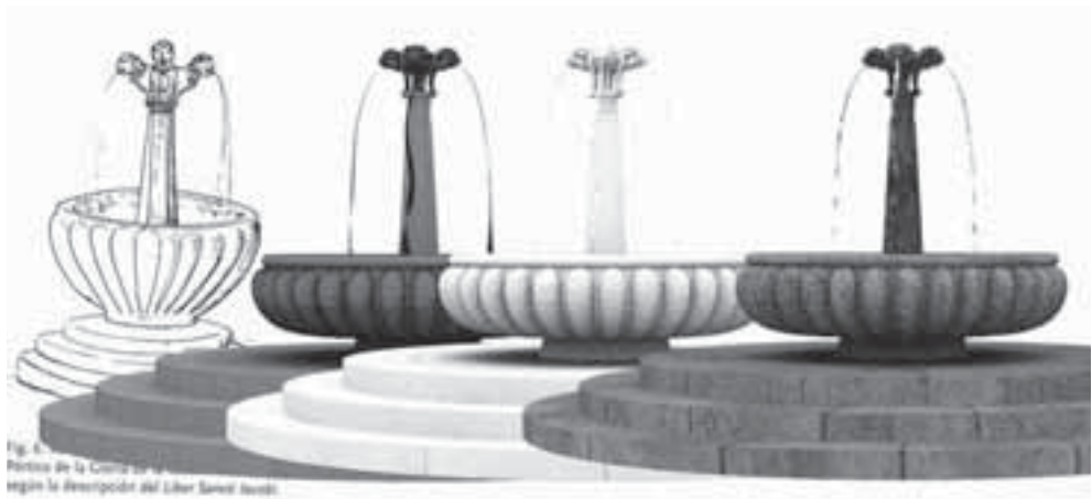
Fig. 3. Proceso de reconstrucción 3D de la fuente del Paradisus. Autor: Tomás Guerrero-Magneto Studio.

la comparación con monumentos u obras de arte coetáneas 12 . En primer lugar, con respecto a la articulación del atrio o Paradisus que se extendía ante la fachada, se decidió la colocación perpendicular de los nueve escalones que daban a la plaza, cuyo nivel era similar al del atrio actual 13 , así como el aspecto de la célebre fuente dedicada por el Tesorero Bernardo en 1122 (fig. 3), en la que se corrige, en parte, el dibujo reconstructivo