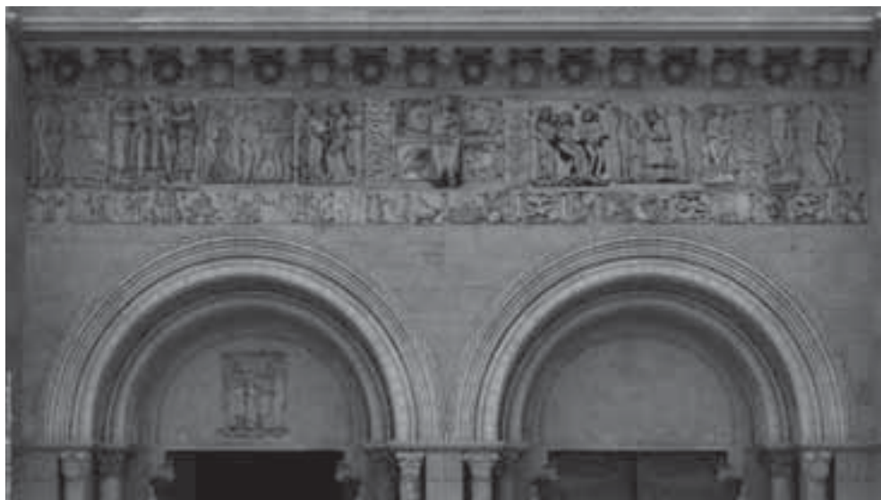
Fig. 6. Reconstrucción 3D de la Porta Francigena: frontispicio. 2010.

terías (Cristo y Símbolo de Mateo). En el lado izquierdo se disponía, de izquierda a derecha, la Creación de Adán y Eva –reaprovechadas en los contrafuertes de Platerías–, el Pecado Original –no conservado–, y la Reprensión de Adán y Eva (Museo de la Catedral). Por su parte, en el lado derecho, de izquierda a derecha, el ciclo proseguía del siguiente modo: la Expulsión de Adán y Eva –reutilizada en el frontispicio de Platerías– y el Trabajo de nuestros primeros padres: Adán trabajando la tierra –no conservado– y Eva amamantando a Caín (fig. 8), reaprovechado en el frontispicio de Platerías. Para la recomposición de las piezas desaparecidas se ha recurrido a ciclos contemporáneos. En el caso del Pecado Original se siguió la escena los marfiles de Salerno (ca. 1085), incidiendo en el hecho de que posiblemente el árbol del Bien y del Mal era una higuera, como sucede en el Tímpano de las Tentaciones de Cristo de Platerías. Por su parte, para la representación de Adán trabajando la tierra se acudió a la Biblia de Moutier-Grandval (Tours, s. IX) (fig. 9), por su posible eco en la iconografía general del ciclo.