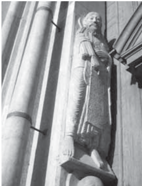
Fig. 13. Catedral de Cremona, fachada occidental, jamba izquierda: Wiligelmo, Jeremías, 1107-1117.

cimiento que el Libro V, 9 del Códice Calixtino tiene de la ciudades de Saint-Gilles y Arles, cuyas reliquias, relicarios –en especial, el Arca de San Gil–, y lugares santos son descritos en la Guía de forma minuciosa 37 . En segundo lugar, la existencia de itinerarios similares realizados desde la Península en el siglo XII, como el emprendido por el rabino Benjamín de Tudela hacia 1160, que tras recorrer el camino de Saint-Gilles, realiza en barco el trayecto entre Marsella y Génova, para después continuar hasta Pisa y Lucca 38 . Estas dos ciudades italianas están, de hecho, muy