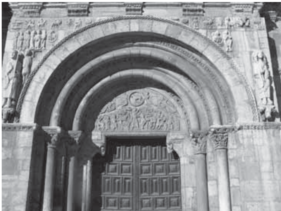
Fig. 19. San Isidoro de León, lado sur, Puerta del Cordero, ca. 1101.

junto realizado bajo el mecenazgo de la infanta Urraca de Zamora, patrona de San Isidoro, entre la década de 1090 y el año de su fallecimiento, 1101, mientras que Gerardo Boto, a partir del análisis de la fases constructivas del edificio, propone que la portada estaría realizada antes del año 1110, si bien reconoce que ya se debía estar trabajando en la fachada en 1101 65 . En mi opinión, siguiendo, en particular, la sólida hipótesis de Francisco Prado-Vilar 66 , existen suficientes argumentos para pensar que en la concepción del citado portal leonés se gestaron algunas de las soluciones de la francigena , como la tipología de friso sobre puerta o el carácter artístico del denominado “Maestro del Cordero” activo en la Porta Francigena , deudor epigonal del estilo de las lastras mayores de las enjutas del citado portal leonés.