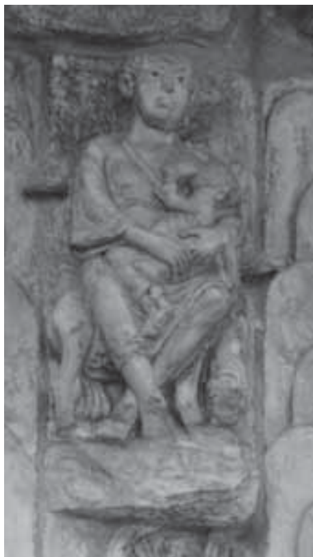
Fig. 8. Catedral de Santiago, brazo sur del transepto, fachada de Platerías, frontispicio: Eva amanta a Caín, 1101-1111. Relieve procedente de la Porta Francigena.