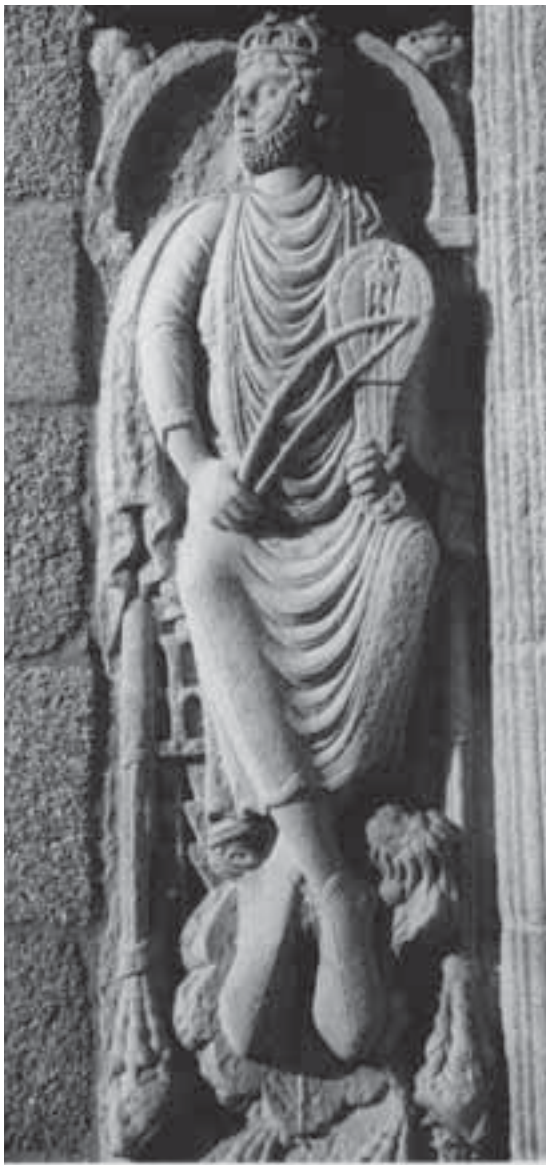
Fig. 17. Catedral de Santiago, fachada sur (Platerías), contrafuerte izquierdo: Maestro de la Porta Francigena, David, 1101-1111. Relieve procedente de la Porta Francigena.