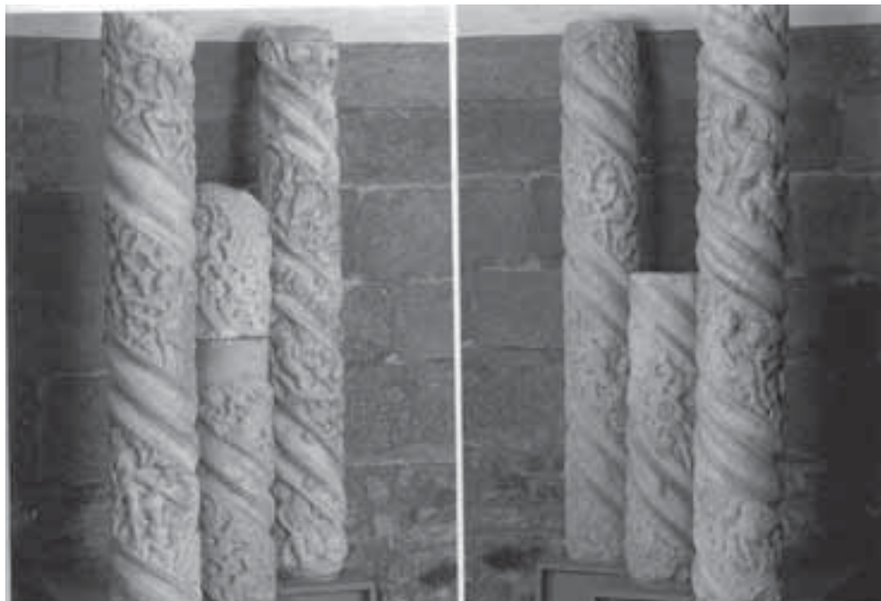
Fig. 15. Maestro de la Columnas Entorchadas, columnas entorchadas de la primitiva puerta norte, ca. 1101-1111. Museo de la Catedral de Santiago.

del Mediterráneo Occidental estaba amenazada por los constantes ataques de los piratas sarracenos de Mallorca. Habrá, pues, que esperar a la expedición catalano-pisana de 1114-1115, con la conquista de Mallorca, para asegurar un tránsito fluido por dichas aguas 42 .