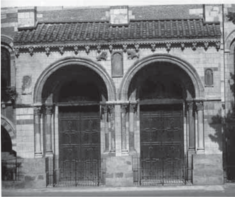
Fig. 5. Basílica de Saint-Sernin de Toulouse, brazo sur del transepto: Porte des Comtes, 1080-1090.