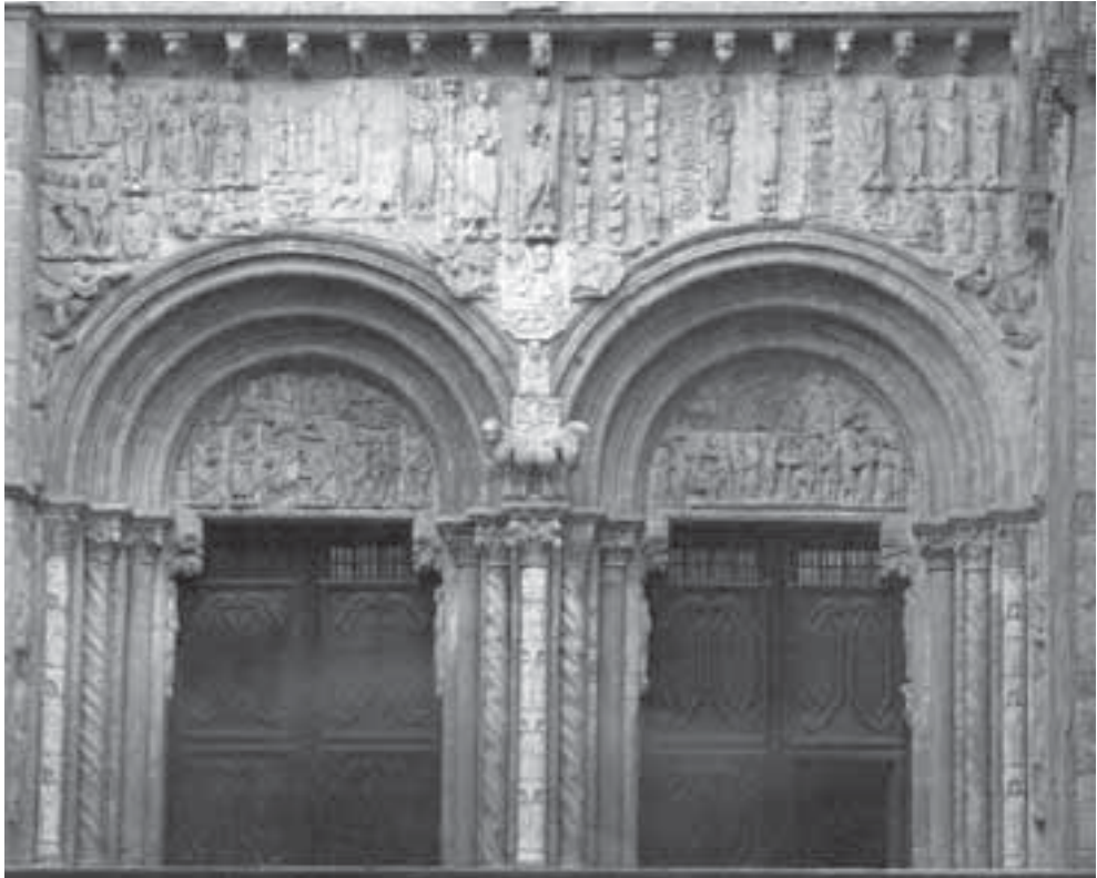
Fig. 4. Catedral de Santiago, brazo sur del transepto, fachada de Platerías, 1103-1111.

En tercer lugar, con respecto al friso, a pesar de la menor altura de la fachada norte, al mantenerse las líneas de imposta generales de la catedral, éste gozaba de la misma anchura y altura que el de Platerías, por lo que su aspecto, más cercano al espectador, debido a la menor elevación de las puertas, debía de ser conmovedor. Según la descripción del Calixtino (V, 9), éste se encontraba profusamente decorado con relieves escultóricos, de los cuales hemos conservado una buena parte, ya que tras la destrucción de la fachada un grupo de lastras fue reutilizado en el frontispicio, jambas y contrafuertes de Platerías, mientras que otra serie de piezas fueron guardadas, e incluso reutilizadas como decoración, en las dependencias ca-