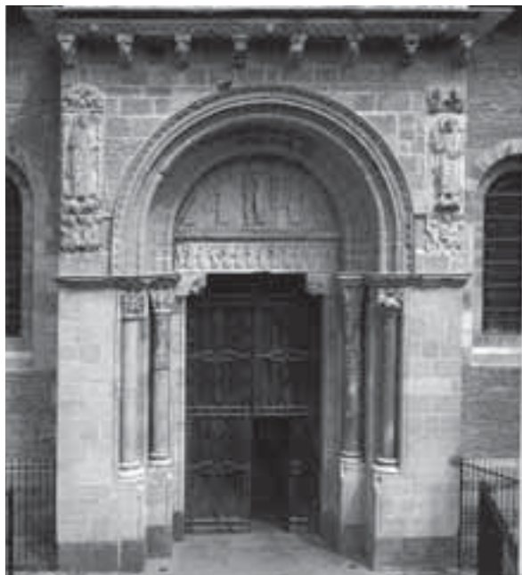
Fig. 10. Basílica de Saint-Sernin de Toulouse, cuerpo de las naves, lado sur: Porte Miègeville, ca. 1100-1105.

Desde un punto tipológico, las fachadas del transepto compostelano se han puesto siempre en directa relación con las de la basílica de Saint-Sernin de Toulouse, en particular, con la Porte des Comtes (ca. 1080-1090) (fig. 5), por su estructura de puerta bífora abocinada, con capiteles historiados, decorada con relieves de enjuta en el frontispicio y coronada por un cornisa de canes figurados. A estos elementos arquitectónicos figurados se sumaron, años más tarde, en la Porte Miegèville (ca.