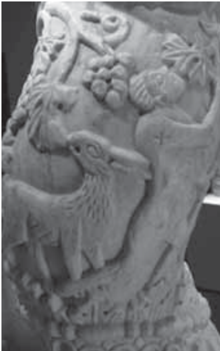
Fig. 20. Santissima Trinità dei Monti, columna salomónica, ca. 1090-1100.

La primitiva Porta Francigena parecía adherirse así, de manera muy directa y particular, al ideario del arte de la Reforma Gregoriana haciendo una cita explícita a la Roma Papal. Es esa voluntad estético-ideológica, propia de una sede pretendidamente apostólica, la que permite destacar la primitiva puerta compostelana de otros monumentos escultóricos emergentes entonces fuera de Roma, que también se sumaban entonces al ideario reformista, como la Porta Miègeville o la fachada occidental de la Catedral de Módena.