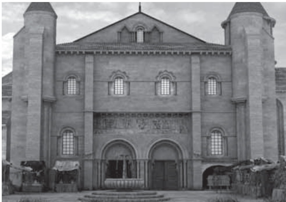
Fig. 1. Porta Francigena de la Catedral de Santiago (Reconstrucción hipotética en 3D). 2010. Asesor científico: Manuel Castiñeiras. Producción técnica: Tomas Guerrero-Magneto Studio © S.A. de Xestión do Plan Xacobeo. Santiago de Compostela.

de la Catedral de Santiago, realizadas por Tomás Guerrero-MagnetoStudio, bajo mi dirección científica. Con ellas se quería devolver al paisaje monumental del templo jacobeo el posible aspecto de dos obras desaparecidas, llevadas a cabo durante el largo gobierno de Diego Gelmírez (1100-1140), que resultaban fundamentales para entender el papel de este personaje como patrón de las artes.