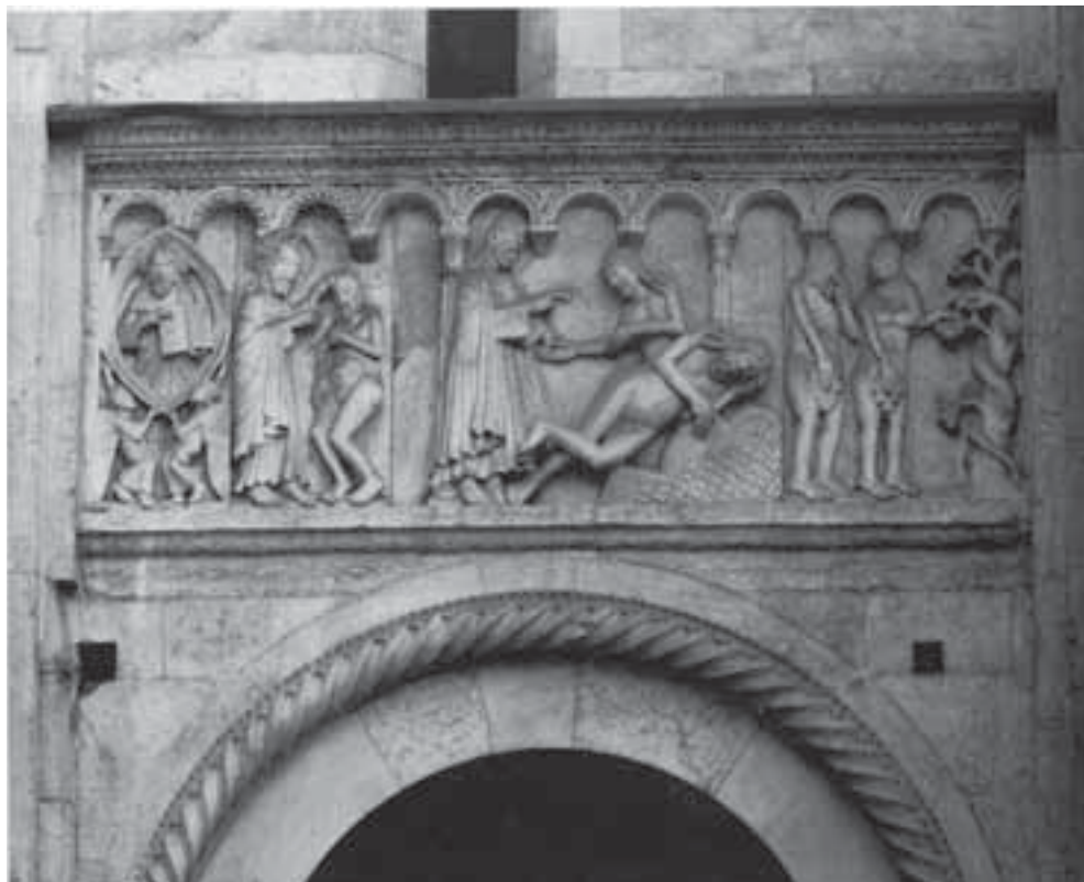
Fig. 11. Catedral de Módena, fachada occidental: Wiligelmo, friso del Génesis, ca. 1099-1106.

la fachada (figs. 12-13), bajo un friso con el ciclo de Adán y Eva. Por último, para las columnas figuradas compostelanas, sobre todo en el caso de la Francigena , los marmolistas romanos que elaboraron a finales del siglo XI las columnas salomónicas de San Carlo a Cave (Lacio) (fig. 14) y de Trinità dei Monti (Roma) parecen haber sido el punto de referencia de Compostela (fig. 15) 30 .