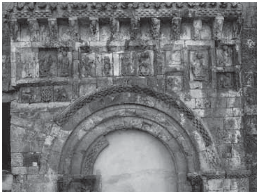
Fig. 7. San Quirce de Burgos, puerta norte, 1125-1150.

espacio evocador del Paraíso, se colocaron lastras vegetales como las conservadas en el frontispicio de Platerías en los extremos de la narración.