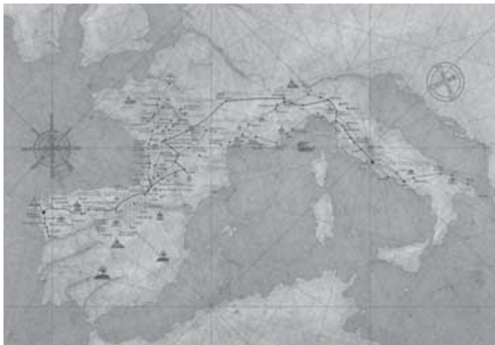
Fig. 16. Itinerarios de los viajes de Diego Gelmírez a Roma en 1100 y 1105. Realizado bajo la dirección científica de M. Castiñeiras para la Exposición: Compostela y Europa. La historia de Diego Gelmírez , París-Roma-Santiago 2010.

las buenas relaciones existentes entre el nuevo prelado compostelano y Pedro de Rodez, obispo de Pamplona, quien en 1101 había contratado para su fábrica a Esteban, maestro de obras de Santiago, y que a la vuelta del periplo gelmiriano le pidió a éste consagrar la capilla de Santa Fe en la cabecera de la catedral compostelana (HC, I, 19), 45 .