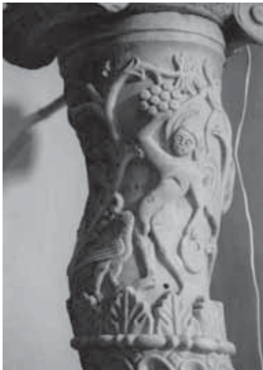
Fig. 14. San Carlo a Cave (Lacio), columna salomónica, ca. 1093.

Aunque no sabemos exactamente las etapas que siguió la comitiva, es muy posible que el intrépido Gelmírez hubiese viajado entonces en el más estricto anonimato por miedo a ser capturado o reconocido por el depuesto obispo de Compostela, Diego Peláez (1075-1088), que vivía exiliado en la Corte de Pedro I de Aragón y Navarra (1094-1104) y que todavía albergaba deseos de volver. De ahí las reticencias, meses después, de la curia compostelana a que Gelmírez repitiese en 1101 ese viaje por tierras de Aragón para ser consagrado obispo en Roma (HC I, 9, 1) 41 . Considero, pues, poco probable otras posibilidades, como la que Gelmírez hubiese evitado en 1100 el reino de Aragón a través del Reino Taifa de Zaragoza para alcanzar el condado de Barcelona y desde allí embarcar rumbo al puerto pisano. Cabe recordar que entonces la seguridad de la navegación en esa franja central