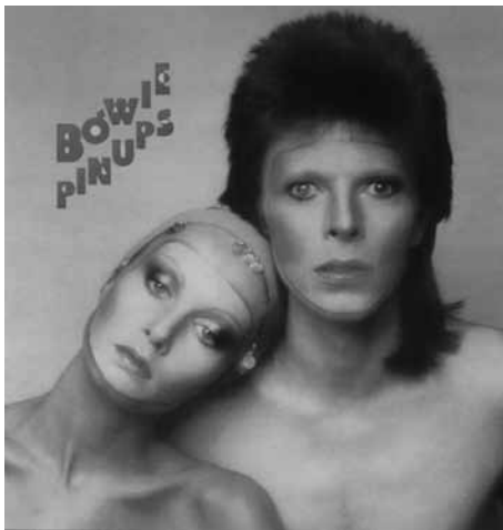
Fig. 4. David Bowie, Pinups (1973).

David Bowie es quizá el músico que mejor encarna esa decadencia asumida por el Rock en este periodo. Como botón de muestra se puede analizar la portada de su LP, Pinups (1973) (fig. 4). En este contexto vuelve a ser fundamental la presencia física del artista en la carátula, con sus atributos icónicos y tipográficos, su nombre y el de la obra. La calidad fotográfica se pone de manifiesto a través de un depurado retrato en color (obra de Justin De Villeneuve, a la sazón fotógrafo de Vogue y Harper's Bazaar). En una pulcra composición sobre fondo azul celeste aparece Bowie en primer plano acompañado por uno de los personajes clave del "Swinging London" -la modelo Twiggy-. Ambos rostros riman en cuanto a tonalidad y expresión. Los torsos desnudos se empastan con el fondo mientras el maquillaje (acreditado a Pierre Laroche) se erige en protagonista gráfico, confiriendo a las dos figuras unos rasgos alienígenas. Destaca asimismo el esculpido corte de pelo -Kabuki- y el tono naranja del tinte capilar, ciertamente inusual en la presentación cosmética masculina de la época. La tipografía en rojo-amarillo (Ray Campbell) reverbera sobre el fondo con unos caracteres retrofuturistas, entre lo sideral y lo camp.