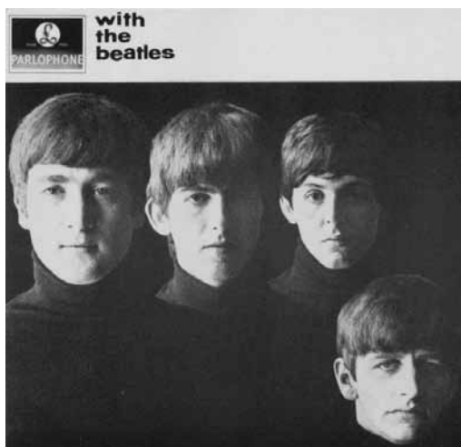
Fig. 2. The Beatles, With The Beatles (1963).

Su carta de presentación discográfica en el mercado mundial se confirmó a través de su segundo álbum, With The Beatles (1964) (fig. 2). La portada está presidida por una fotografía en blanco y negro firmada por Robert Freeman en la que el dramatismo lumínico cobra expresividad a través de un eficaz claroscuro. Una explícita seriedad en la pose pretende elevar la categoría musical; ya no es el grito primitivo del Rock & Roll, estamos ante la proyección visual de una nueva concepción pop en la que imagen y música se complementan y confieren al formato LP un estatus icónico superior. Como observa el propio Freeman se trataba de una apropiación estética más cercana a las portadas de los discos de Jazz 4 . Los integrantes del grupo, ataviados con suéters negros de cuello vuelto, muestran únicamente la mitad derecha de sus rostros delineados bajo