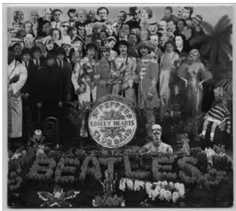
Fig. 3. The Beatles, Sgt. Peppers Lonely Hearts Club Band (1967).

Karlheinz Stockhausen entre Mae West y Aubrey Beardsley. El título del disco queda enmarcado dentro de un elemento real de la parafernalia fotográfica, ya no es un añadido tipográfico postizo, ahora forma parte de la realidad visual del conjunto. Aparecen también una serie de guiños a otros artistas afines -Bob Dylan y The Rolling Stones- y también motivos florales, un televisor portátil, bustos, idolillos hindúes y otros artilugios. Un pastiche pop que apela a la desbordante creatividad que se desprende de la propia música; una colección de canciones amalgamadas con especias exóticas que abren un novedoso horizonte a lo conoci-