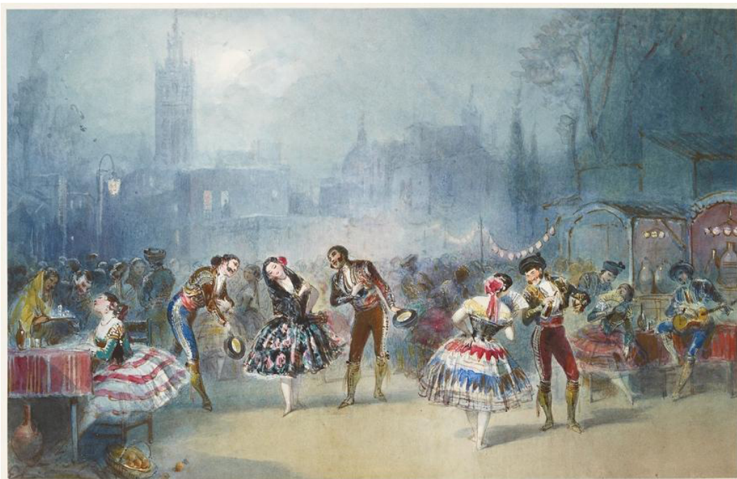
Figura 4. Egon Lundgren. Escena de "Una noche de fiesta en Sevilla", 1854. Royal Collection Trust.