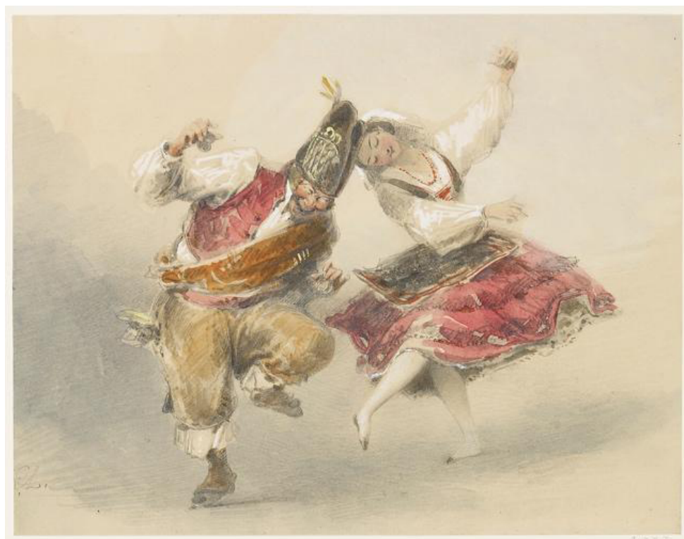
Figura 5. Egon Lundgren. Los bailarines españoles. Galician pas grotesque . 1854. Royal Collection Trust.