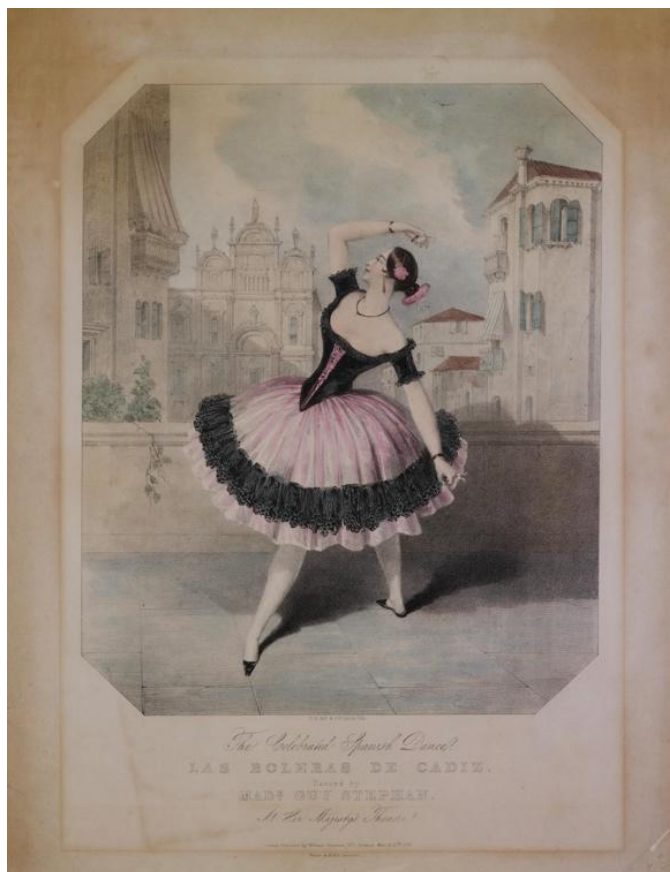
Figura 2. Las boleras de Cádiz por Marie Guy-Stephan. C. Graf. J. H. Lynch. 1844. Colección particular

confeccionó el taller del teatro real no es más que una variación del patrón que creó Lormier para la cachucha de Fanny Elssler en Le diable boiteux en 1836.