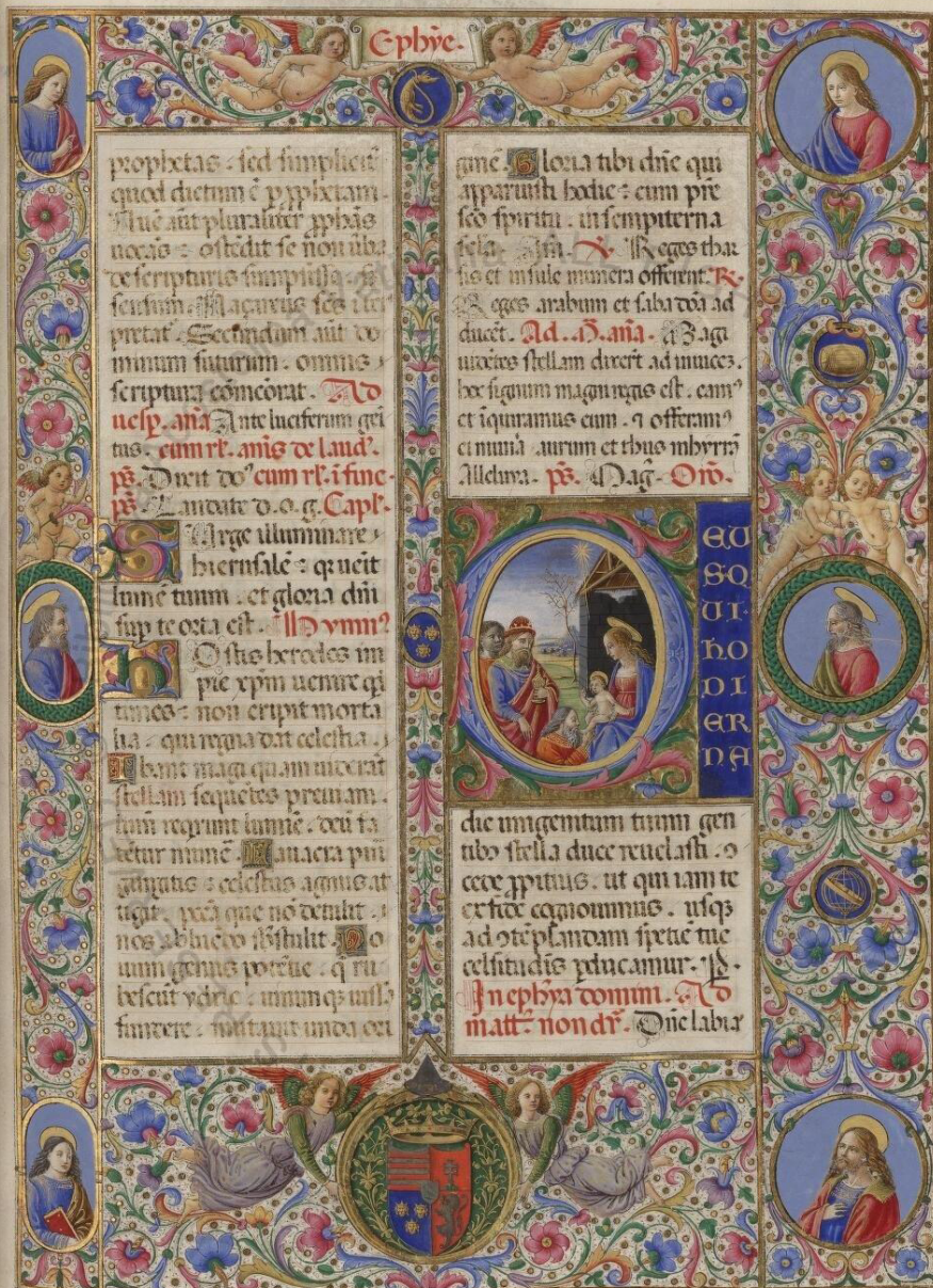
Figura 1. Breviarium Romanum, fol. 67r (Urb. Lat. 112)

a la sobriedad de la escena, únicamente atenuada por un leve modelado obtenido a través de delicados trazos dorados aplicados sobre la superficie policroma de los ropajes.