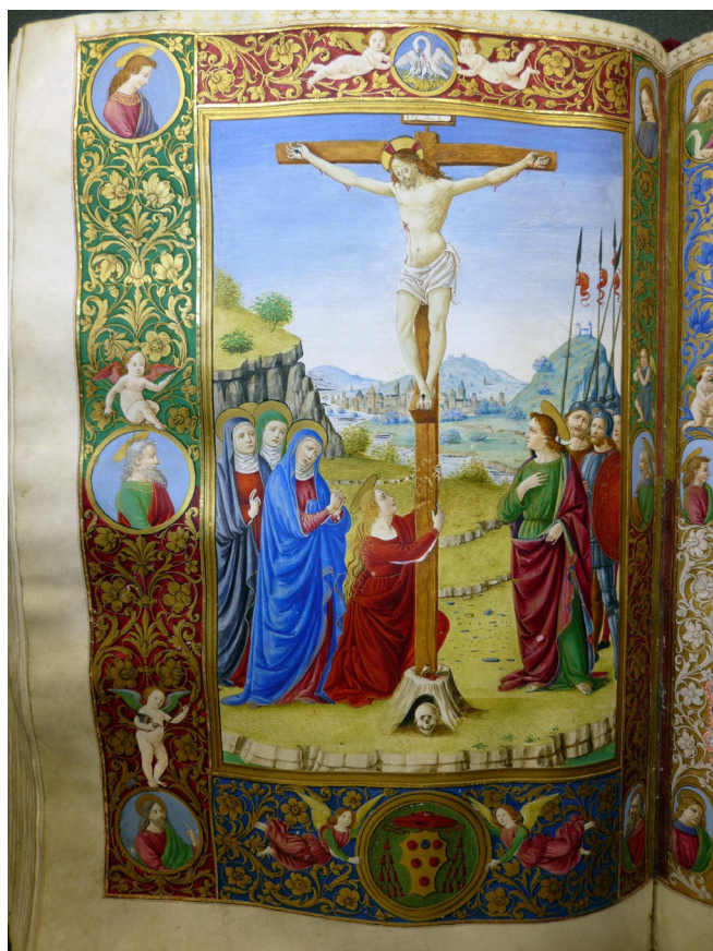
Figura 4. Misal para Juan de Medici , fol.171v. (Ms. 52-10)

En último lugar nos ocuparemos de las letras capitales historiadas, iluminadas en los folios del códice como inicio de las principales fiestas litúrgicas, y que suman un total de dieciocho 56 . Las escenas se presentan, en todos los casos, dentro del marco del ductus de la letra, cuyas dimensiones son aproximadamente de 50 x 50 mm. El diseño de las iniciales sigue un patrón característico en el que tallos vegetales, entrelazados con roleos, conforman su perfil. Estas letras, policromadas en tonos verdes, rojos y azules, destacan aún más gracias al contorno de oro bruñido que las enmarca, aportando una riqueza visual que refuerza la suntuosidad del manuscrito y su función simbólica (fig. 6). Esta fórmula de construir el perfil de las iniciales se repite en la mayoría de los códices relacionados con la estética atribuida al miniaturista florentino, paralelo que reconocemos en el manuscrito Urb.lat.112 de la Biblioteca Apostólica Vaticana, uno de los más variados y ricos de su producción.