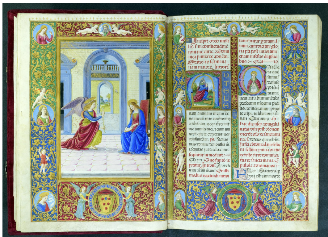
Figura 3. Misal para Juan de Medici, ca. 1492, fol.8v.