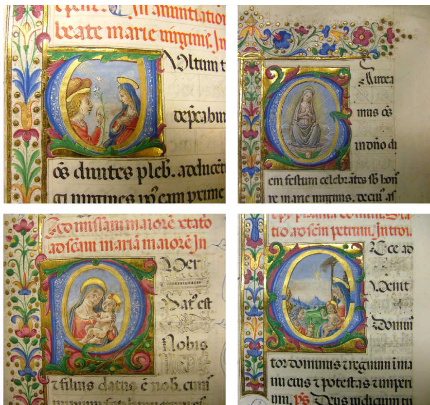
Figura 6 Misal para Juan de Medici, ca. 1492 Ejemplos de letras capitales iluminadas. ©Biblioteca Capitular de Toledo (BCT Ms. 52-10)