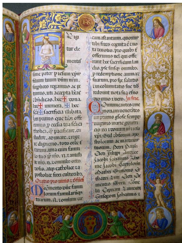
Figura 2. Misal para Juan de Medici , fol. 172r. ©Biblioteca Capitulare de Toledo (Ms. 52-10)