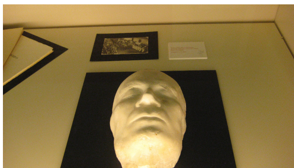
Réplica de la máscara funeraria de Rubén Darío y foto del entierro en León.