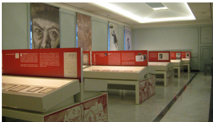
Paneles de la Exposición.

Durante este año se han producido dos novedades en el entorno del Archivo Rubén Darío: la exposición y el fin de la digitalización de los documentos que custodiaba el Departamento de Filología Española IV. Tras estos dos acontecimientos el archivo pasa al cuidado de la Biblioteca Histórica, que ya ha iniciado el proceso de recuperación de tintas y documentos.