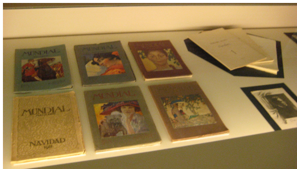
Números de Mundial Magazine y de la Revista Archivo Rubén Darío dirigida por el Dr. Oliver Belmás. Foto de Darío con adorno guardada en el Archivo.

dad no sólo se conservaron los documentos (más de cinco mil), sino que tuvieron como lugar privilegiado de conservación España, dando lugar al Archivo más abundante que se conoce de Darío y uno de los más ricos Archivos de Autor que existen en nuestro país.