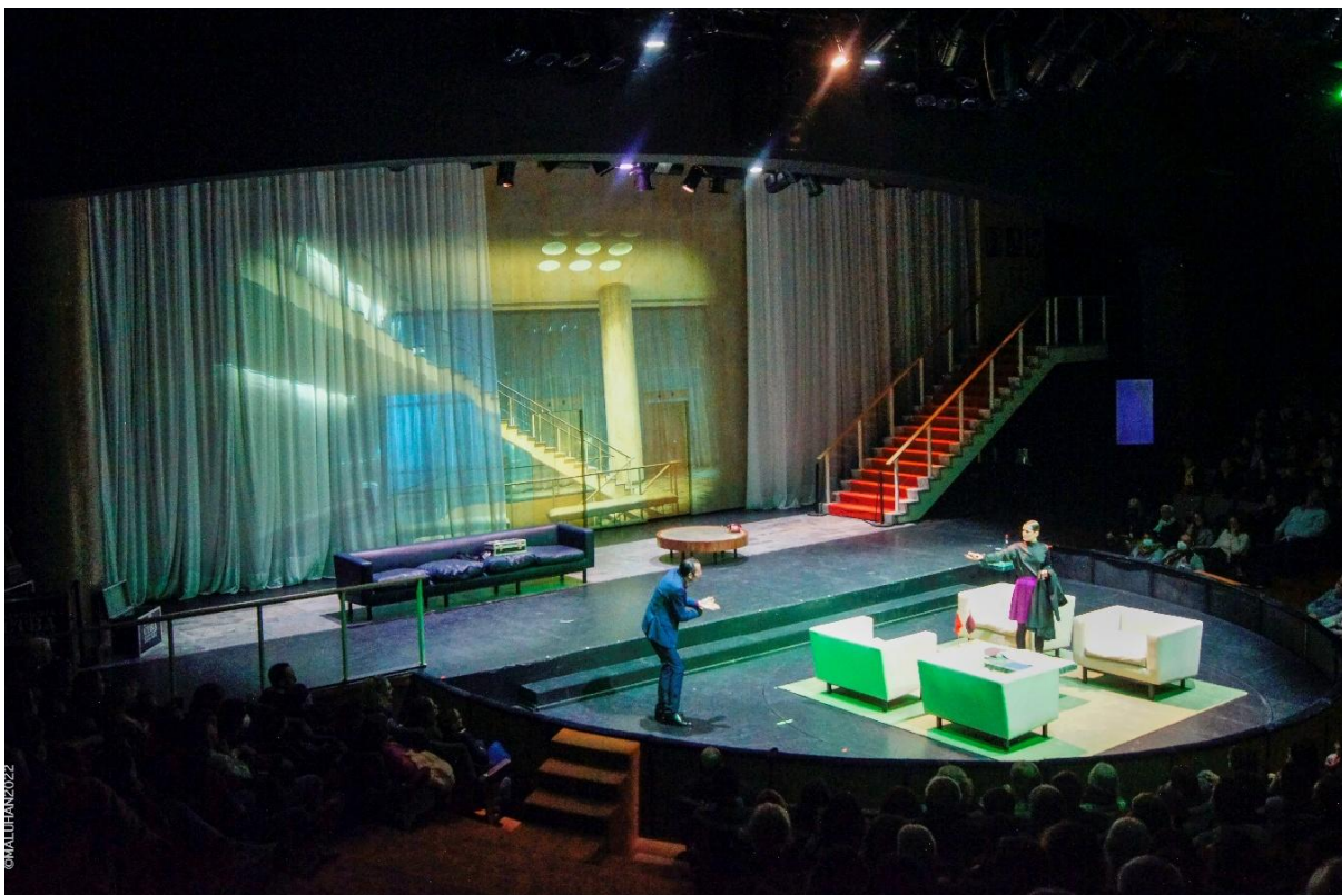
Epígrafe foto 1: En escena, con diseño de Micaela Sleigh, se reproduce el hall de la Sala Casacuberta del que provienen las/los espectadores, con sus columnas, escaleras, murales, cortinas, alfombras, ascensores, ventanal y muebles.

Eva Halac concluyó al respecto, poniendo especial relevancia en la enunciación del texto de Sartre en el presente y en la territorialidad porteña: “ Las manos sucias seguía siendo la misma, pero el punto de vista, el mío, que es el que ofrezco al espectador, estaba puesto en ese cruce de ideas vertiginoso, expuesto, e incómodo, donde cualquiera podía aparecer cuando se abrieran las puertas de un ascensor, o se bajarán las escaleras”.