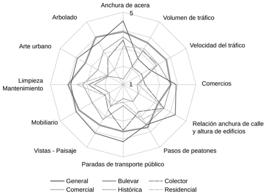
Figura 4. Diferencias en la valoración de factores de forma General y en base a tipologías.