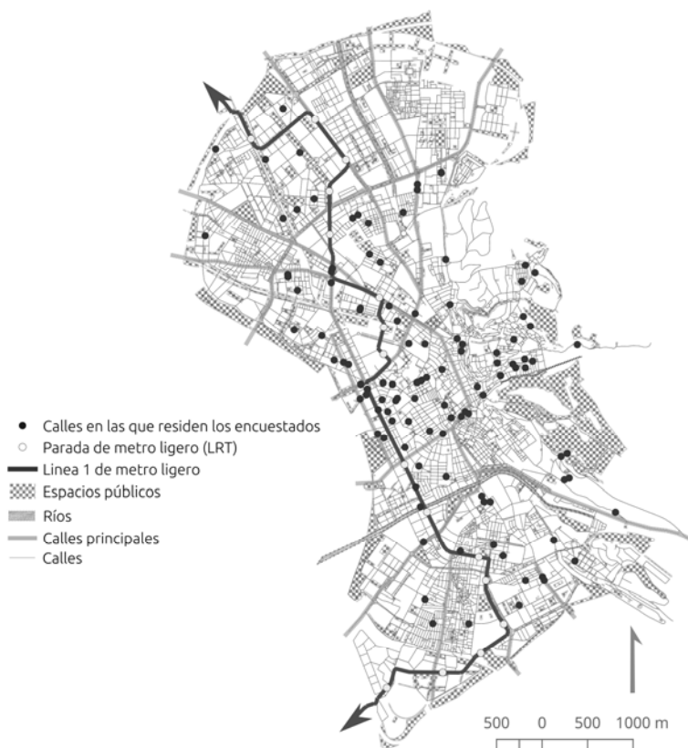
Figura 1. Área de estudio: Granada.

La ciudad de Granada ha sido seleccionada como área de estudio dado que, como se mencionaba anteriormente, reúne algunas características interesantes que hacen que sea favorable para los desplazamientos peatonales. La región andaluza donde se localiza Granada es conocida por sus características climáticas que han tenido un efecto profundo en su urbanismo. La ciudad tiene una distancia máxima entre el centro de la ciudad y los barrios periféricos de aproximadamente 3,5 kilómetros, o lo que es lo mismo, aproximadamente 40 minutos a pie (Figura 1).