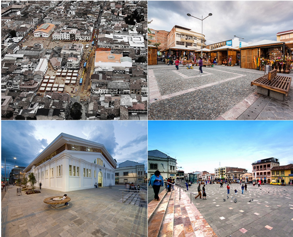
Figura 6. Conjunto de intervenciones en Plaza Rotary, Centro Comercial Popular, Mercado 9.de Octubre y Plaza Cívica

El Premio Latinoamericano de Arquitectura Rogelio Salmons, en la categoría Rehabilitación Urbana, obtenido por el conjunto de intervenciones en la Plaza Rotary, el Centro Comercial Popular, el Mercado 9 de Octubre y la Plaza Cívica al noreste del centro histórico de Cuenca, ha sido el más relevante. En el caso de la Plaza Rotary y del Mercado 9 de Octubre se mantuvieron los usos de comercio popular y de mercado respectivamente, el Centro Comercial Popular incluía obra nueva al conjunto, mientras que en la Plaza Cívica se construyó un parqueadero subterráneo y se eliminaron los usos de estancia en la plataforma a nivel de calle (Figura 6).