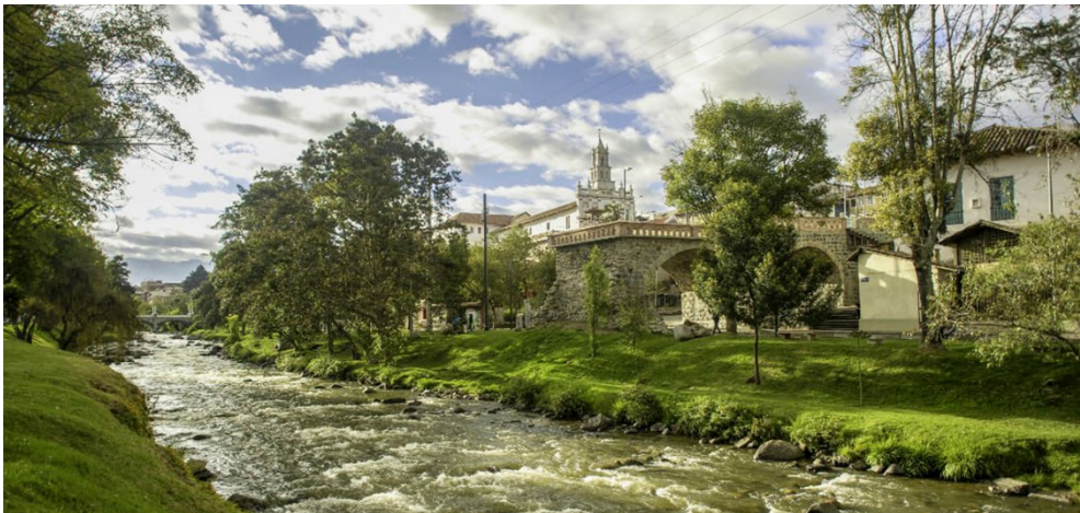
Figura 3. Río Tomebamba con el Puente Roto y la Iglesia de Todos Santos.