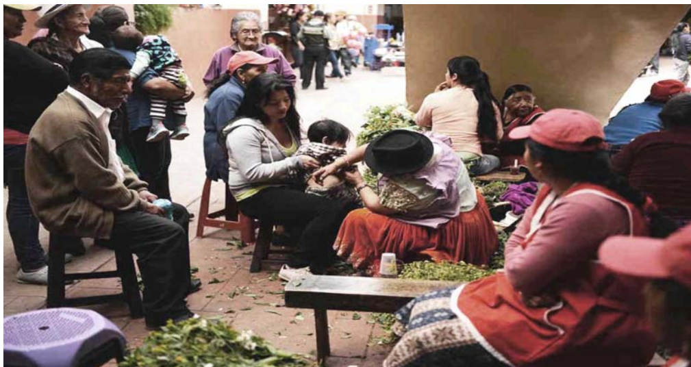
Figura 7. Práctica de medicina tradicional (limpia) bajo las escaleras del Mercado 10 de Agosto, Cuenca

Sobre las consecuencias provocadas por las 49 intervenciones en espacios públicos, se identificaron cambios de uso caracterizados por la eliminación de prácticas populares de plazas y calles como venta de productos perecibles de bajo costo, medicina tradicional y manifestaciones artísticas populares, aunque en algunos casos dichas prácticas han sido reubicadas en edificaciones, no cuentan con espacios adecuados (Figura 7) y muchas se han excluido. Consecuentemente, los conflictos más frecuentes se relacionan con la expulsión de cierto grupo de comerciantes. Cuando las intervenciones han derivado en cambios de uso aparece como consecuencia recurrente la disputa generada entre antiguos y nuevos usuarios, reclamos sobre las nuevas condiciones de habitabilidad y discrepancias en el diseño urbano. La magnitud de estos conflictos ha sido diversa, con incidencias a nivel del área patrimonial, de los sectores aledaños y en casos como el de la Plaza San Francisco la disputa por el espacio ha incidido a nivel urbano, trascendiendo en la opinión pública 4 , hecho que retrasó la construcción del proyecto y su entrega hasta inicios de 2019.