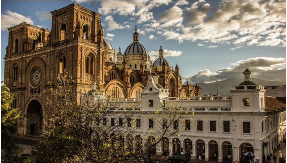
Figura 4. Catedral de la Inmaculada Concepción de Cuenca.