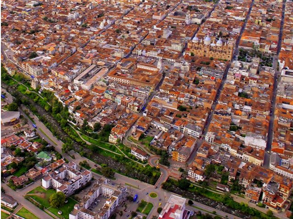
Figura 2. Vista aérea del Centro Histórico y El Barranco del Río Tomebamba.