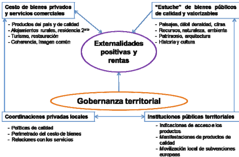
Figura 2. Gobernanza territorial, cesto de bienes y renta.