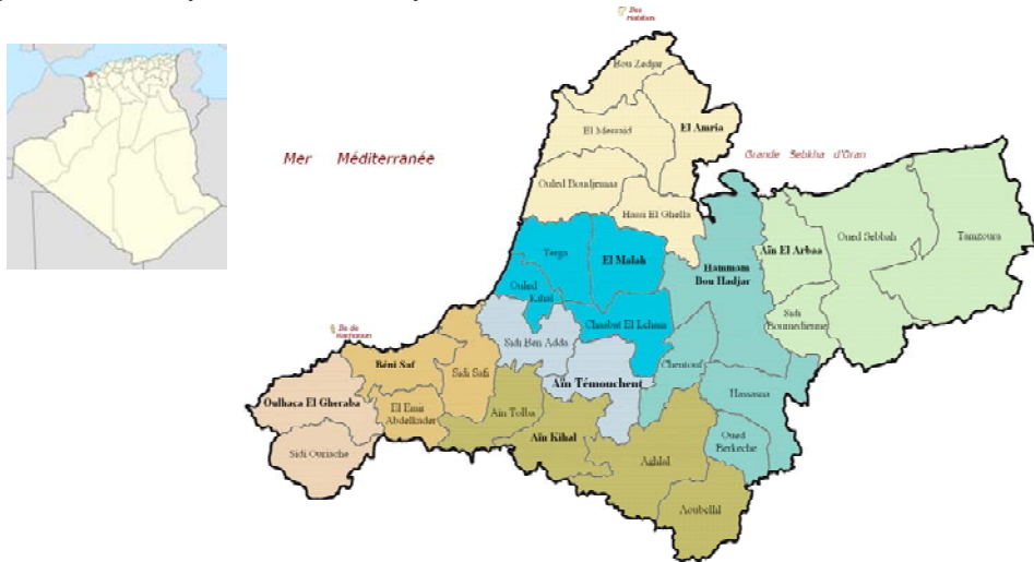
Figura 3. Comunas y Dairas de la Wilaya de Ain Témouchent.

El espacio en el que se ha realizado el estudio es la wilaya (provincia) de Ain Témouchent en Argelia. Se trata de un territorio ubicado en el noroeste del país, rodeado por las tres principales ciudades de la zona, Orán (segunda ciudad en importancia del país), la antigua ciudad imperial de Tlemcen y Sidi Bel Abbés, y a sólo 80 km de la frontera con Marruecos, lo que la convierte en un importante nudo de intercambio y comunicaciones en el noroeste del país. Está dividida administrativamente en 8 dairas o cantones que agrupan a 28 comunas o municipios. Su capital, Ain Témouchent, da nombre a la wilaya.