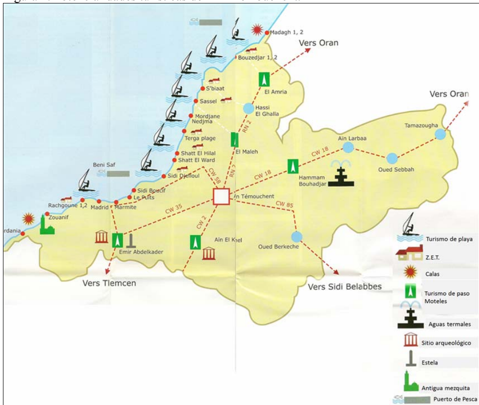
Figura 4. Potencialidades turísticas de Ain Témouchent.