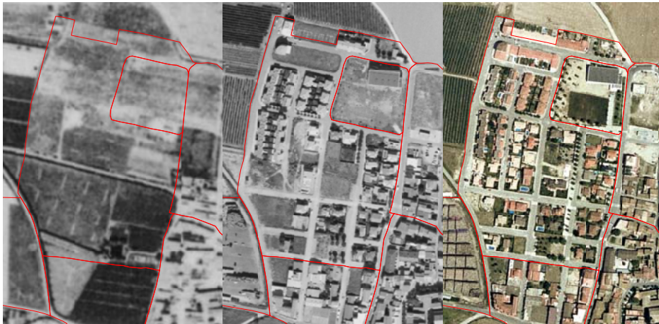
Figura 2. Fragmento de las fotografías aéreas y ortoimágenes utilizadas en la fotointerpretación (1957-1997-2004) 9

Respecto a la asignación de las diferentes categorías, primero se cartografiaron las piezas urbanas según los tipos del poblamiento, y posteriormente se asignó el tipo de hábitat más representativo a cada una de ellas, aunque esto no excluye que puedan darse otros, por ejemplo, unifamiliares aisladas en una zona catalogada como de edificios entre medianeras o edificación en bloque en una zona ocupada mayoritariamente por unifamiliares aisladas. La asignación sólo del hábitat predominante en una pieza urbana con un determinado tipo del poblamiento se debe a que la variable cartografiada fue, como se ha dicho, la superficie urbanizada y no la superficie construida, y a que no se llegó a discriminar edificación por edificación.