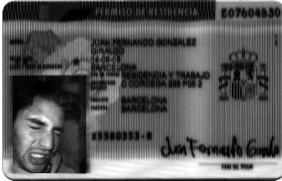
Fig. 4.: Fronteras:85.60x53.98mm.

http://jfxgonzalez.blogspot.com/2007/06/fronteras-8560-x-5398-milmetros.html (Consultado 11/03/2008).