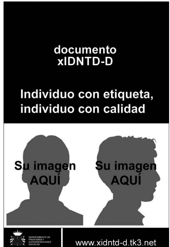
Fig. 7. “Solicite su documento”, http://www.xidntd-d.aalcubo.com/5solicitesudocumento.htm (consultado 11/03/2008).

Destacando este carácter regulador y legitimador de ciertas disposiciones de “sujetos-cuerpos” particulares y su incidencia en la delimitación de la esfera de lo propiamente “humano” he analizado tres intervenciones socio-políticas