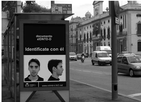
Fig. 6. Campaña publicitaria http://www.xidntd-d.aalcubo.com/3requisitosparasubtencion.htm (consultado 11/03/2008).

cómo para su emergencia y habilitación es necesaria la articulación de complejas redes de relaciones entre elementos heterogéneos –no todos ellos humanos, ni dotados de voluntad e intencionalidad– pero que constriñen y marcan los “cuerpos” de tal forma que se vuelven reconocibles como “humanos” en un momento espacio-temporal concreto. Para ello he mostrado algunas de las formas en las que se produce la ecuación “sujeto-humano-cuerpo-ciudadano” y algunos de los límites sobre esta ecuación. En particular, he analizado cómo un elemento no-humano como es un “documento de identidad/identificación” se convierte en un espacio privilegiado, en una verdadera “extensión protésica” que aspira a recoger la verdad del “cuerpo” prometiendo asegurar su firmeza y contener su cambio, garantizando que éste sea siempre legible y reconocible dentro de unos regímenes de frontera que regulan los tránsitos posibles y aquellos proscritos: entre los “cuerpos” que pertenecen a la esfera del “Estado-nación” y son “ciudadanos” o –extendiendo la esfera de la ciudadanía aquellos que son “ciudadanos europeos”– y el resto, cuyo estatus varía dependiendo de la calidad de sus papeles, de sus “extensiones protésicas”; pero también, esos otros cuerpos que no se pliegan a la legibilidad sexual establecida y tienen dificultades para posicionarse en el binomio excluyente “varón” y “mujer”.