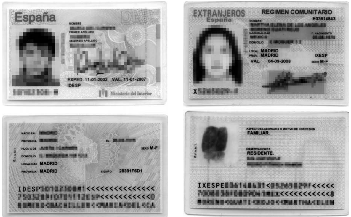
Figuras 1 y 2 ejemplos de documentos de identidad para personas “nacionales” y “extranjeras” –en este caso en “régimen comunitario”– actualmente vigentes en el Estado español. En ambos se han distorsionado los datos para garantizar el anonimato.

determinadas nacionalidades favorezca o perjudique los tránsitos fronterizos. Además, en los documentos de identidad se incluye una fotografía del rostro de la persona que ostenta el documento: el rostro aparece en nuestras sociedades como elemento identificador por excelencia, junto con la firma, y las huellas dactilares; y en el rostro se condensan múltiples elementos de reconocimiento racializados y generizados –color de la piel, del cabello, aspecto externo masculino o femenino, etc.– que además se asientan en la promesa de visibilización que fetichiza los cuerpos y que promete que su identidad se volverá transparente, clara e inmediata ante nuestra mirada. En el caso de las huellas dactilares, si bien han desaparecido físicamente del Documento Nacional de Identidad vigente en el estado español, no han desaparecido de las informaciones recogidas por los centros de cálculo desde donde se expiden los documentos, o bien se introducen en pequeños chips junto con otros datos biomédicos –como en el caso de los nuevos pasaportes y DNIs electrónicos–. Sí permanecen bien visibles, sin embar-