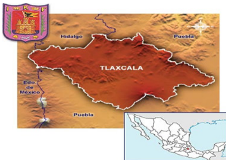
Figura 1. El estado de Tlaxcala