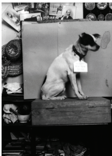
Figura 11. El perro Cherry , 1893