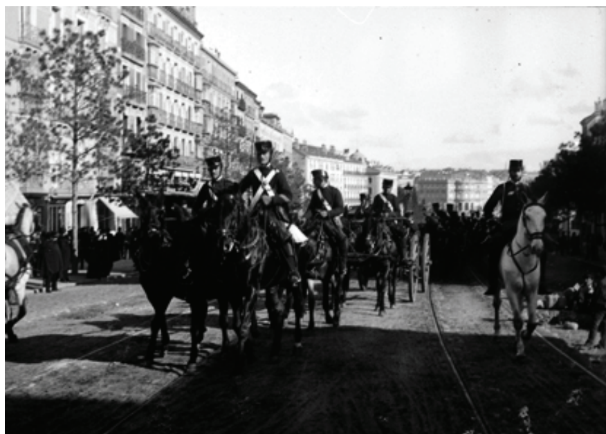
Figura 22. Madrid. Grupo de artilleros en la calle de Alcalá, 1893