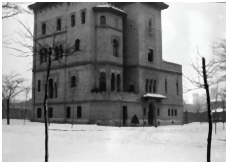
Figura 20. Madrid. Instituto Valencia de Don Juan en la calle Fortuny nevada, 1894