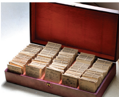
Figura 5. Estuche con los negativos de vidrio

El conjunto de negativos de vidrio se encuentra en el fondo denominado “Cajas Verdes” (fila 1, columna 4-Izq.), que se describe en su exterior como: “Foto (sic) antiguas curiosas sobre cristal. Abanicos. FRAGIL” (este apunte indica que en algún momento se guardaron abanicos en ella). Los negativos se conservan dentro de un estuche, en buen estado, y junto a ellos una placa de vidrio de 13x18 cm en la que se reproducen cuatro retratos de personajes ilustres: Luis Lasso de la Vega, Pedro Lasso de la Vega (Conde de los Arcos), Mariana de Mendoza (Condesa de los Arcos) y María Pacheco y Aragón.