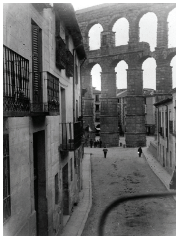
Figura 14. Segovia. Acueducto,