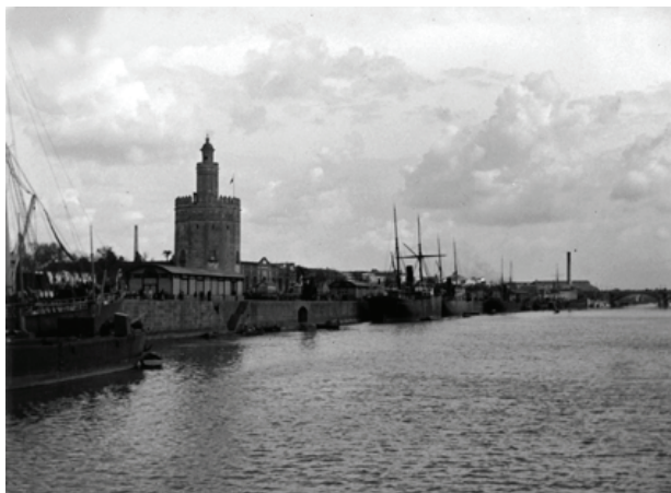
Figura 10. Sevilla. El Guadalquivir y la torre del Oro, 1898