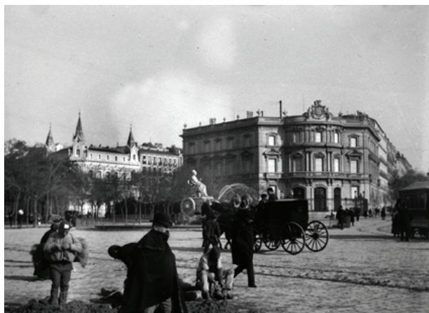
Figura 7. Madrid. Plaza de Cibeles, diciembre de 1893

La valoración en cuanto a su contenido presenta una colección de carácter documental obtenida en función de intereses privados que responde a la secuencia vital; es decir, como testigo de las vivencias. Hemos establecido nueve categorías temáticas (Tabla 3). El número de imágenes se reparte de manera desigual, destacando las fotografías de personajes (96), en su mayoría retratos de la familia Osma-Crooke, y las vistas de ciudades (56), en especial las de Madrid (Figura 7). La colección de retratos, además de numerosa, es importante para la identificación, pero también para estudios relacionados con la sociología, la cultura e incluso con el vestido. A este conjunto se suman los retratos de la Familia Real (Alfonso XIII, la infanta Isabel de Borbón, María Cristina de Habsburgo-Lorena, etc.) que hemos optado por incluir en un apartado específico, compuesto de 25 originales de los que 16 son del acto público de la Jura de Alfonso XIII en el Congreso de los Diputados.