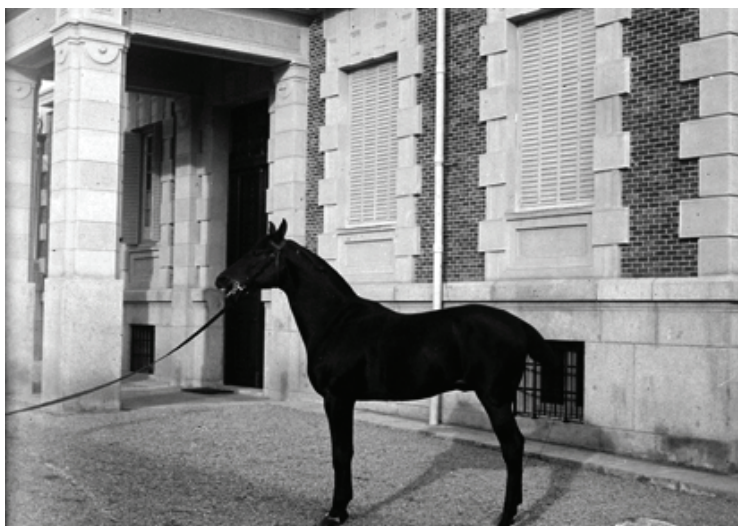
Figura 13. El caballo Sarah , propiedad de la familia Torre-Arias, 1895