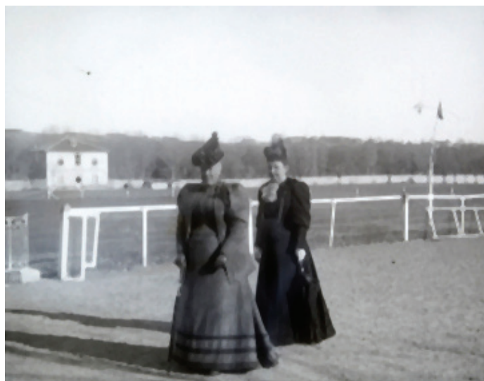
Figura 24. Isabel de Borbón en el hipódromo de Madrid, marzo de 1894