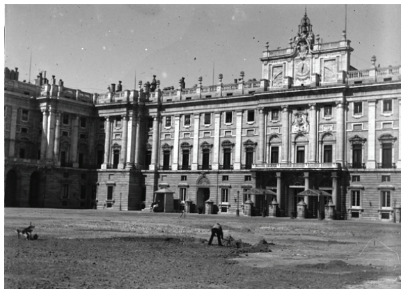
Figura 19. Madrid. Palacio Real, 1894