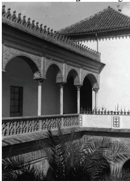
Figura 15. Sevilla. Palacio de las Dueñas, 1898.