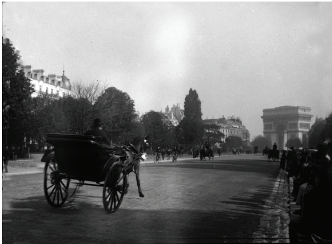
Figura 18. París. Paseo del Bosque de Bologne, 1893