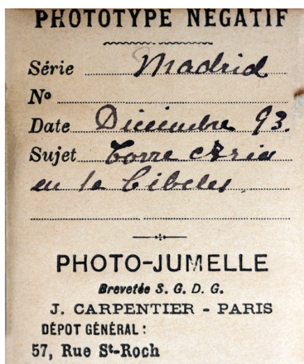
Figura 6. Sobre de negativos, 4x5 cm