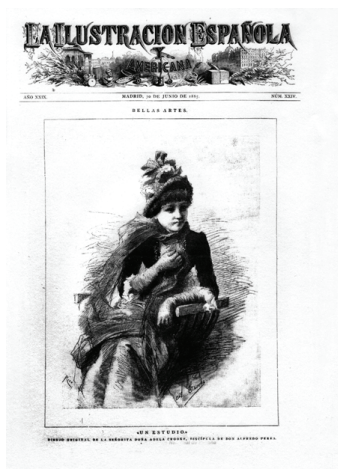
Figura 2. En el estudio. Ilustración de Adela Crooke en portada de La Ilustración Española y Americana , 30 de junio de 1885

Crooke fue una mujer culta, erudita, estudiosa del arte y de la historia, pintora, acuarelista, e ilustradora, discípula del artista Alfredo Perea 5 . El 30 de junio de 1885 se publicó en portada de La Ilustración Española y Americana uno de sus dibujos, titulado “Un estudio” (Figura 2), sobre el que escribió Eusebio Martínez de Velasco: