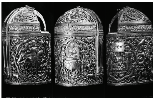
Figura 1. Bote persa de marfil.

la segunda mitad del siglo XIX, en la Guía-inventario de la colección fotográfica del Instituto de Valencia de Don Juan , donde indica las pautas de su recuperación y conservación. Los temas son diversos, siempre relacionados con el arte y la cultura popular: etnografía, costumbres, arquitectura y especialmente la reproducción de obras de arte: pintura, escultura, tapices, encuadernaciones, bordados, armaduras, etc. El primer inventario de Santos (2004), se compone de cerca de 500 imágenes, clasificadas en siete series: 1. Alinari, 2. Laurent (Figura 1), 3. Sucesores de Laurent y otros, 4. Instituto Valencia de Don Juan, 5. Privada, 6. Miscelánea y 7. Foto contemporánea. Además de las fotos de la familia y del edificio, las materias son arquitectura, monumentos, pintura, escultura, tapices, armería, miniaturas, dibujos, grabados, encuadernaciones y reproducciones de arte. En el segundo inventario (2009) añadió 800 positivos realizados, entre otros autores de prestigio, por Laurent (725 fotos), Grimaud, Busato y Bonara. A las imágenes inventariadas por Lázaro Martínez y Santos Quer hay que añadir originales dispersos en archivadores junto a la documentación de piezas del museo, desde albúminas del siglo XIX hasta diapositivas en gran formato (13x18 cm) realizadas por especialitas como Oronoz, fotos empleadas para documentar las piezas.