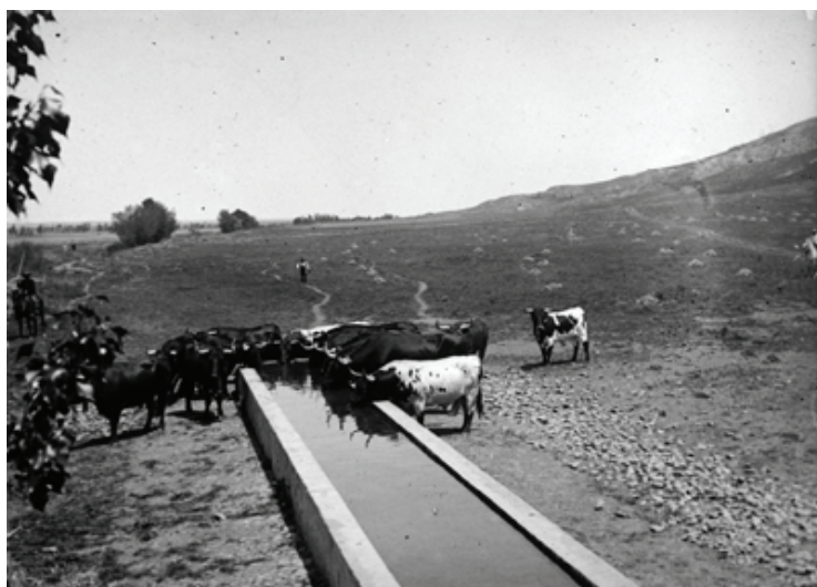
Figura 12. Alcalá de Henares. Toros en el campo. Soto de la ciudad, 1894