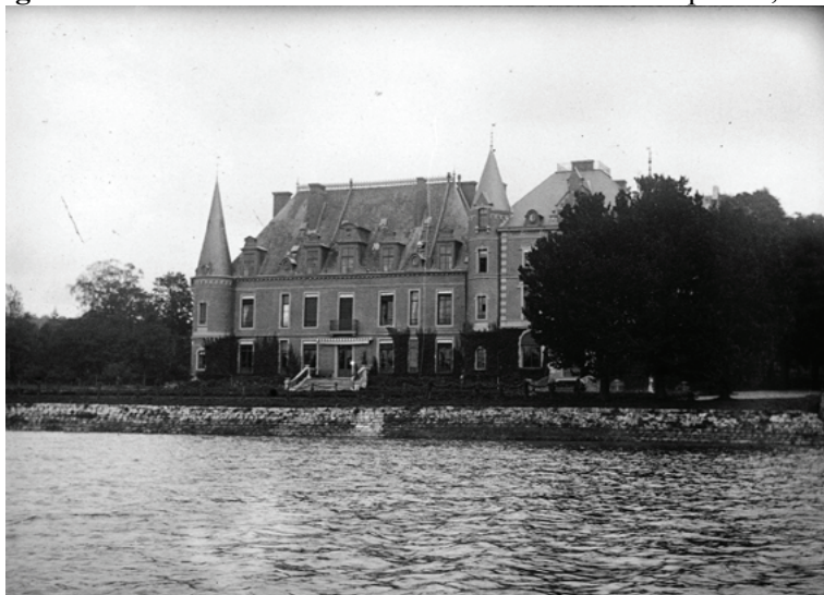
Figura 17. Dave. Vista del castillo y el lago, 1894