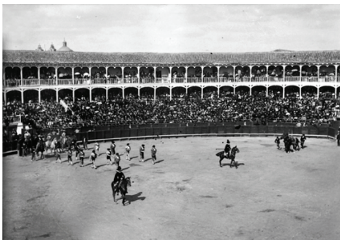
Figura 8. Corrida de toros en Aranjuez. Paseíllo de Mazzantini y Guerrita, 30 de mayo de 1894

En cuanto a las ciudades y paisajes, la media de fotografías es muy superior al resto, como también es significativo el número de negativos sobre animales (30), en especial los de caballos (18), que se completan con la colección de fotos de Cherry , el perro de la familia que fue enterrado en el jardín del palacete de la calle Fortuny.