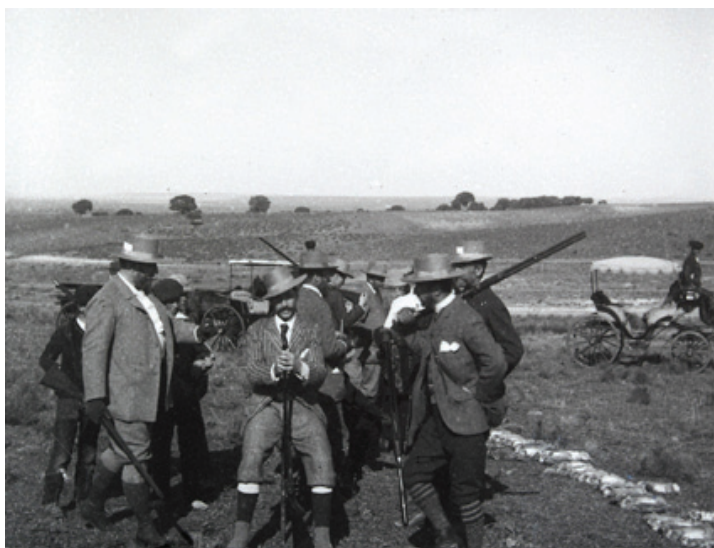
Figura 9. Cazadores en la finca La Flamenca de Aranjuez, febrero de 1894