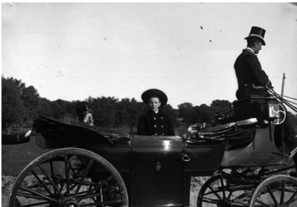
Figura 23. Alfonso XIII niño, marzo de 1894