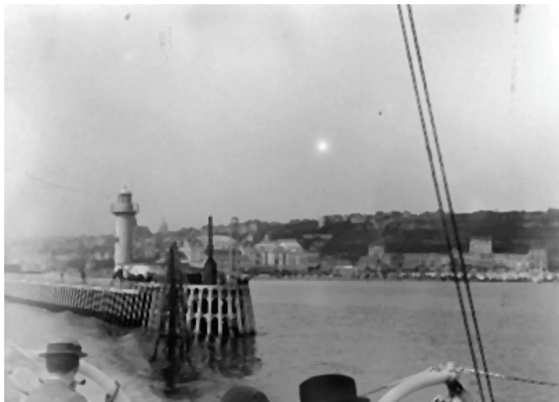
Figura 16. Eastbourne. Canal de la Mancha. Vista del puerto, 1893