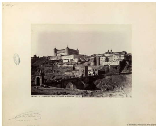
Ilustración 3: Puente de Alcántara (Toledo).