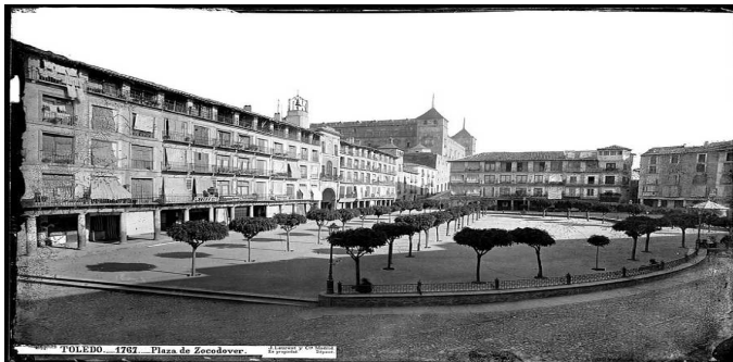
Ilustración 4: Plaza de Zocodover (Toledo).