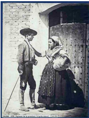
Ilustración 8: Escenas y gentes populares de Toledo.