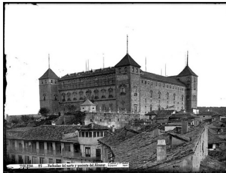
Ilustración 6: Alcázar de Toledo.