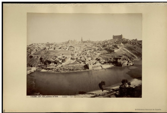
Ilustración 1: Vista Panorámica Toledo.