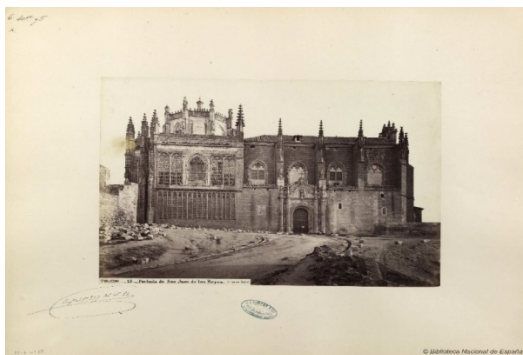
Ilustración 7: Monasterio de San Juan de los Reyes.