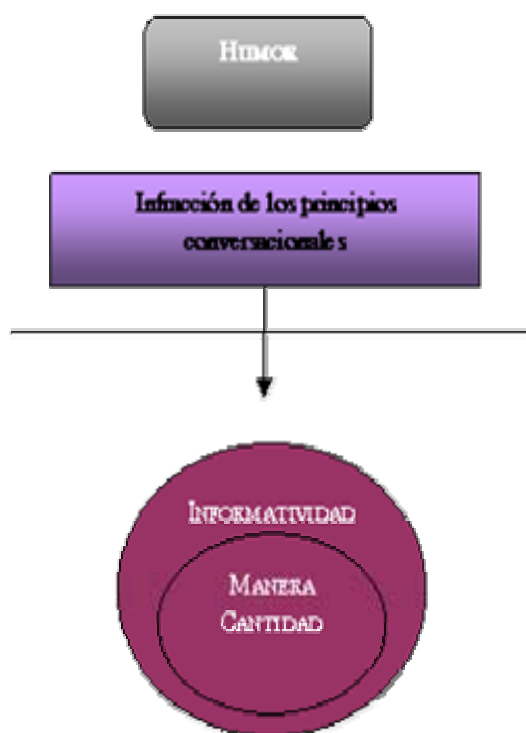
Figura 1: Infracción de los principios conversacionales en el humor

Como veremos, el principio de Informatividad, principio de refuerzo para Levinson (2000), se infringe de forma frecuente en el humor; las huellas de esta infracción son los indicadores que tienen que ver con las relaciones semánticas, como la polisemia, la ambigüedad, la homonimia, la paronimia, etc. El resto de principios quedan supeditados a la infracción de este principio, el de Informatividad, como se representa en la Figura 1: