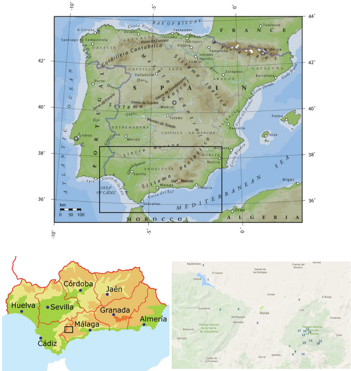
Figure 1. Location of visited sites in Serranía de Ronda.

da, which includes 17 sites in the province of Málaga and two in the province of Cádiz (Figure 1) in cooperation with the Mandragora group in this occasion (which belongs to the Serranía de Ronda Studies Association).