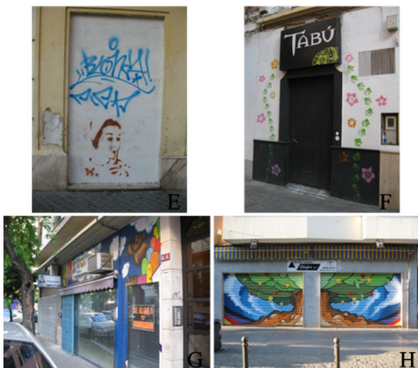
Figura 4. Piezas E, F, G y H de la figura 2