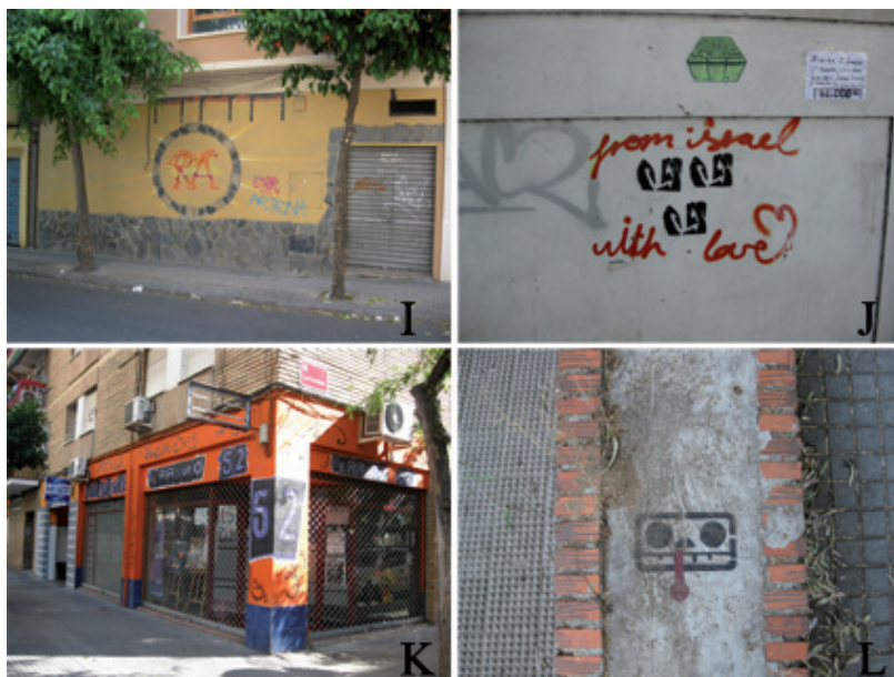
Figura 5. Piezas I, J, K y L de la figura 2