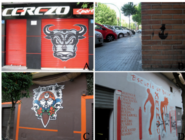
Figura 3. Piezas A, B, C y D de la figura 2.

algunas zonas de mayor concentración, en un ejercicio de mimetismo bastante común. Como decimos, todo ello se contrastará más adelante con las partes restantes para obtener los resultados. Nuestro interés en este artículo no es la documentación exhaustiva de la zona ni la atribución a uno u otro artífice, que aún deben esperar un tiempo prudencial, sino demostrar que existen suficientes manifestaciones para iniciar una discusión sobre su consideración. Así pues, prescindimos de un catálogo descriptivo de todas ellas e integramos algunos ejemplos con el único propósito de ilustrar los argumentos del discurso.