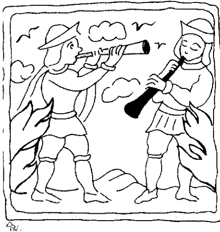
Fig. 2.—Escuela catalana. Pareja de grallas. Segunda mitad del siglo XVIII.