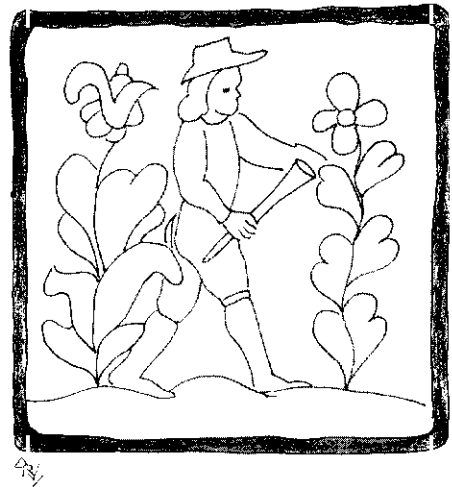
Fig. 3.—Escuela catalana. La gralla. Siglo XVIII.