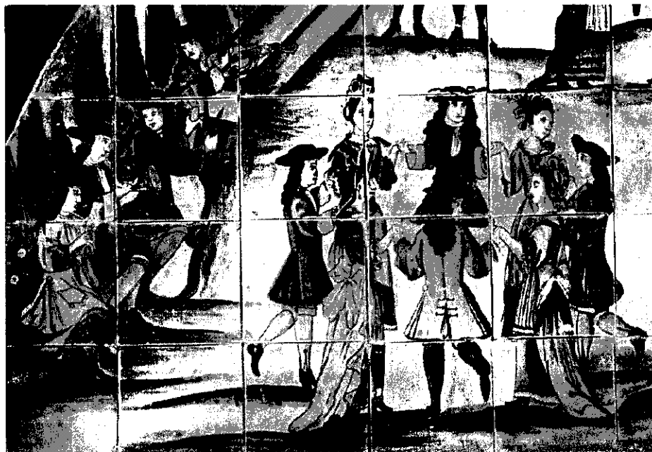
Fig. 4.—Escuela catalana. Plafón «La xocolatada». Hacia 1710. Fragmento inferior izquierdo. Cuarteto musical antecedente de «La cobla y danza», antecedente de la sardana.