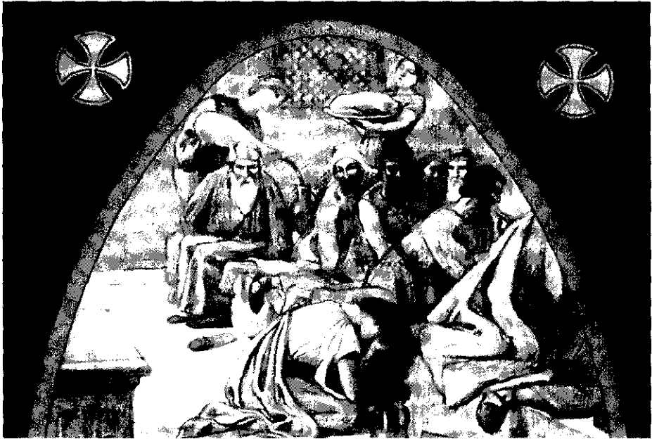
Fig. 3.—Dibujo firmado por J. Llimona sobre papel ocre, en el que se reproduce la escena de la Magdalena ungiendo los pies de Cristo en casa del fariseo.