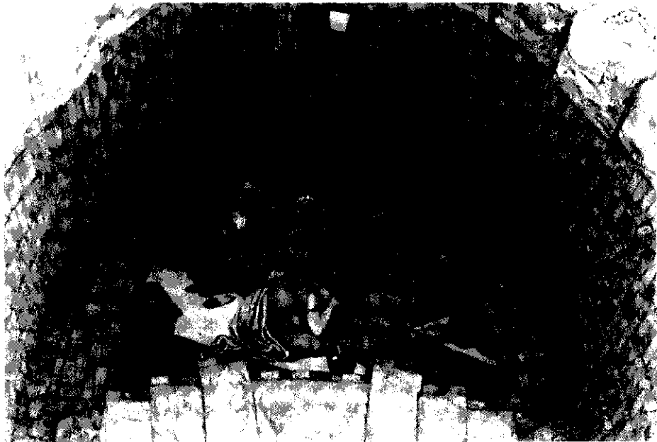
Fig. 4.—Tímpano central del santuario decorado con azulejos valencianos.