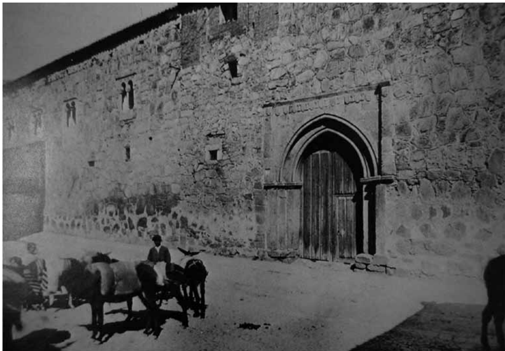
Fig. 2. Palacio de los Dávila (Ávila). Siglos XIII-XIV. Fotografía Archivo Mas [tomada de GÓMEZ MORENO, Manuel, Catálogo Monumental de la Provincia de Ávila, Madrid, Institución Gran Duque de Alba, 1983, p. 363].

lacios de Segovia 28 o el palacio de Curiel de Duero, en Valladolid 29 . Además se publican las primeras plantas y croquis de algunos palacios, como la del palacio de Juan Sánchez de Sevilla en Salamanca 30 , por lo que se convierten en punto de partida para las investigaciones posteriores.