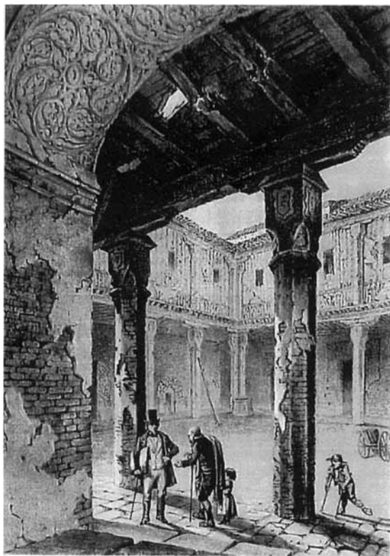
Fig.1. Palacio de Gutierre de Cárdenas (Ocaña. Toledo). Segunda mitad del siglo XV. Litografía de Parcerisa [tomada de QUADRADO, José María, Recuerdos y Bellezas de España. Castilla la Nueva , Madrid, Imprenta de Repullés, 1853, p. 464].

mudéjares, lo que se traduce en un aumento de la nómina de edificios estudiados y citados, tanto en los Boletines de estas Sociedades, como en artículos de otras revistas especializadas 25 y monografías artísticas.