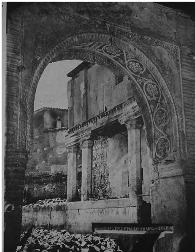
Fig. 4. Arco del palacio del rey don Pedro (Toledo). Finales del siglo XIV.

Tras la publicación de esta obra, los estudios sobre palacios concretos toledanos decaen y se inauguran una serie de estudios transversales sobre la evolución de las estructuras arquitectónicas, como los de Molénat y Passini, que analizan los restos conservados a la luz de la documentación conservada. Esta línea de estudios es relativamente reciente, y profundizar en ella puede aportar nuevas perspectivas interesantes para el estudio de los palacios mudéjares.