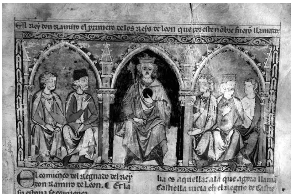
Fig. 5. Imagen de apertura con el retrato de un rey [Ramiro? Sancho IV?] y su corte, Ms. X-I-4, fol. 23r, RBME.

ennegrecido. La imagen está muy deteriorada, ha perdido parte del pigmento, aunque por sus trazos y la aplicación del color recuerda prototipos alfonsíes, especialmente la forma de hacer el cabello, las manos... No obstante esta imagen presenta modificaciones en su composición, apreciables a simple vista al ver como han sido modificados los rostros de algunos personajes (fig. 6), y probablemente fuese retocada posteriormente, tal y como delata el rostro del rey (fig. 7).