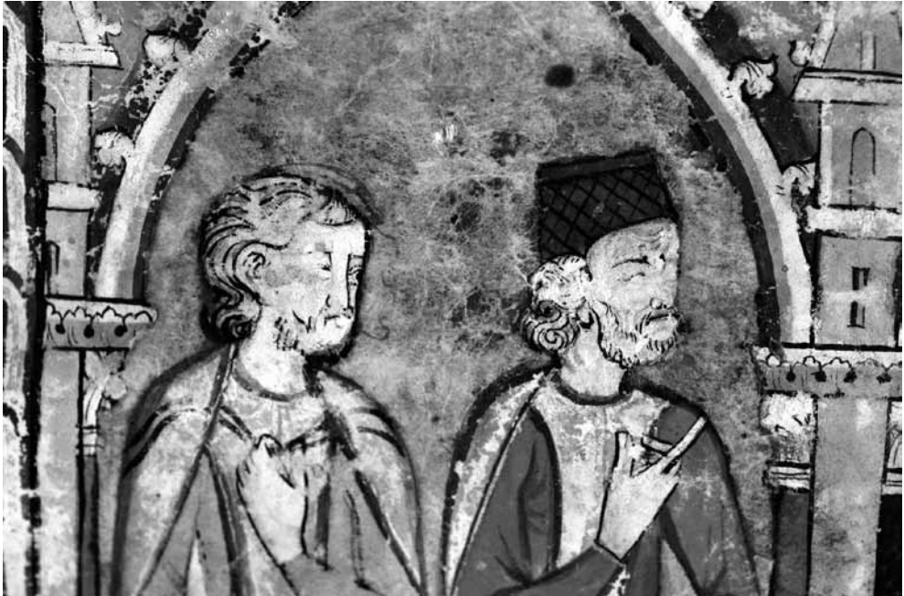
Fig. 6. Detalle del lado izquierdo de la figura 5.