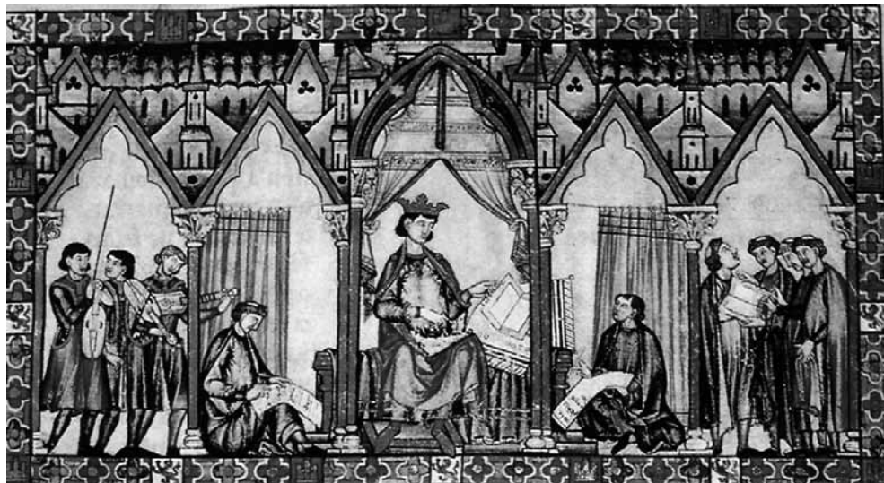
Fig. 1. Imagen de apertura del Códice Rico , Cantigas de Santa María , Ms. T-I-1, fol. 5r

aparecía investido de toda su dignidad como rey de Castilla 3 , y en aquellos casos en los que el escrito adquiriese una dimensión imperial en la proyección alfonsí, el monarca aparecía citado como “Rey de Romanos” 4 . A continuación en el prólogo se daban las razones que habían llevado al rey a impulsar dicha obra, así como el sentido y las implicaciones que podía tener su realización. El prólogo por lo tanto se convertía en una declaración de intenciones del monarca y sus colaboradores hacia la obra que estaban realizando.