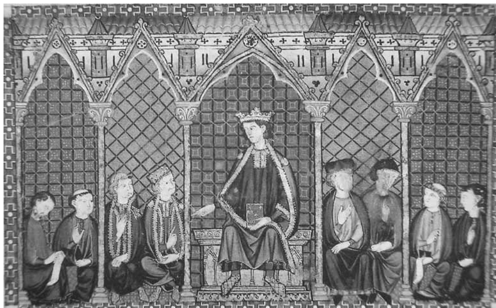
Fig. 3. Imagen de apertura de la IV parte de la General Estoria , Ms. Urb. Lat. 549, fol. 2v, BAV.

A su derecha, izquierda desde la perspectiva del lector, inmediatamente junto al trono, dos hombres ostentan ricos ropajes muy similares a los del monarca, uno de ellos, el que está más cerca del rey, luce un bonete bordado en oro, y a él se dirige el monarca señalándole con su mano. Gesto que es correspondido por el otro personaje estableciéndose la sensación de un diálogo abierto entre ambos. Tal vez se tratara de la figura de Sancho IV, en ese momento el heredero al trono. Junto a estos destacados personajes de la corte hay dos copistas, un clérigo tonsurado, que también parece atender a la conversación, y un laico que toma nota en un pliego. Ambos tienen entre sus piernas un díptico de piel carmesí posiblemente utilizado a modo de carpeta para guardar el material escritorio. En el lado opuesto, a la izquierda del rey, dos clérigos con bonete curvo están situados junto al trono, pero no dirigen su mirada hacia el rey ya que se giran hacia los dos escribas situados junto a ellos, también una pareja formada por un clérigo tonsurado y un laico, provistos de los mismos utensilios de escritura ya mencionados.