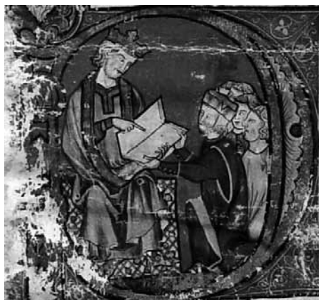
Fig. 2. Imagen de presentación del Libro de las formas et las imágenes , Ms. h-I-16, fol. 1r, RBME.

tes niveles de significación. Dado que en el caso alfonsí estas imágenes no pueden considerarse retratos de autor en el sentido tradicional, ni tampoco son imágenes de presentación, salvo el mencionado caso, utilizaré la fórmula “imagen de apertura” para referirme a ellas 8 .