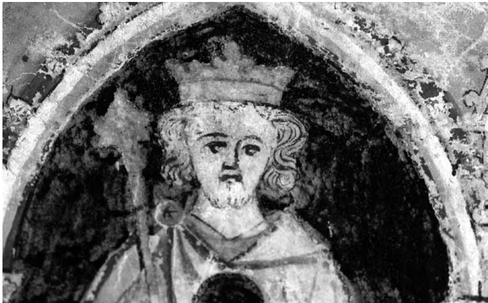
Fig. 7. Detalle de la figura 5.