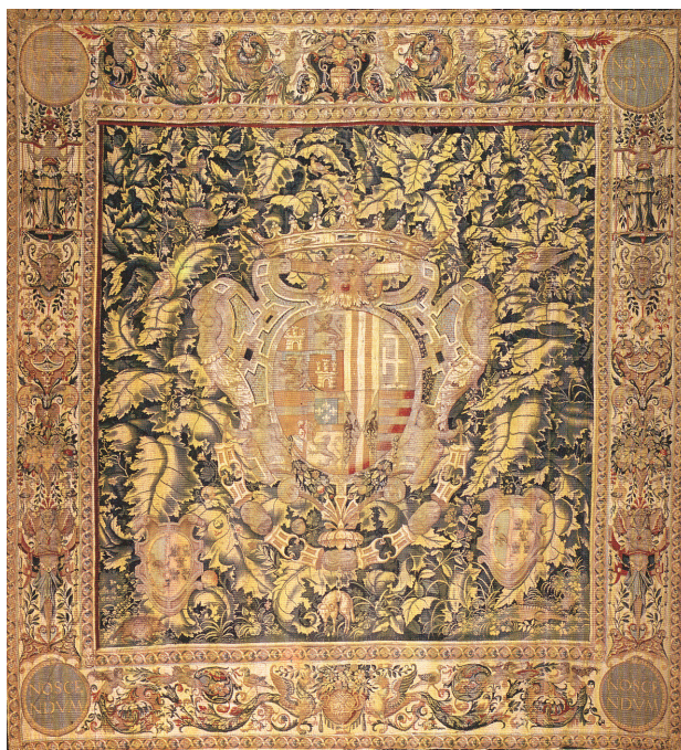
Fig. 2. Reposterero heráldico con el escudo del Duque de Calabria , Museo de Tapices de la Seo. Zaragoza.

Estos paños se fechan en torno a 1540 y se atribuyen al taller de Cornelis de Floris 27 , aunque su diseño también guarda similitudes con la obra de Cornelius Bos 28 . Las marcas del tapiz muestra la doble “b” con el escudete en el centro, obligada a todos los tapices a partir de 1528, y otra marca de la que se ha perdido gran parte.