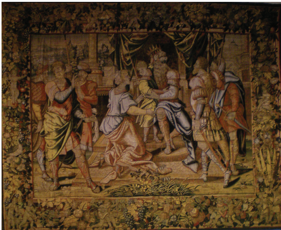
Fig. 3. Moisés niño quita la corona al Faraón , Museo de Tapices de la Seo. Zaragoza.

ciente y figuras heredadas de los modelos rafaelescos, características de estos talleres de la segunda mitad del siglo XVI. En las orlas con motivos que penetran en el campo central, vemos la utilización de guirnaldas flamencas junto al empleo de grutescos.