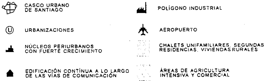
Figura 1. —La periferia urbana de Santiago.

la relativa degradación de las condiciones de vida en unas ciudades que han sufrido intensos procesos de especulación en el mercado del suelo.